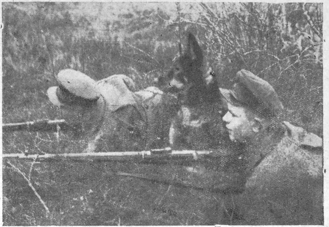
Пограничники в дозоре