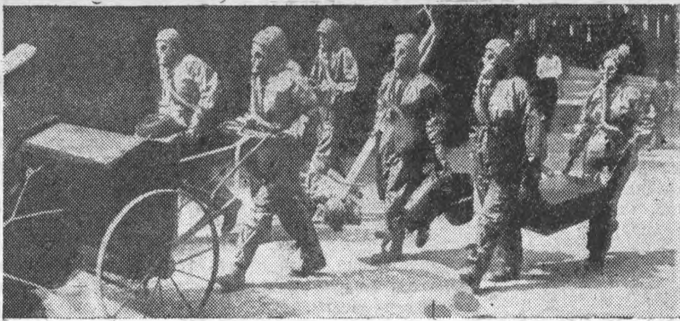
Химическая команда ПВХО ЛИИ на учениях