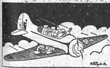
Из ГУУЗ в дирекцию ЛИИ