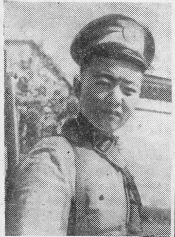
Молодой китайский боец на посту (Шанхай)