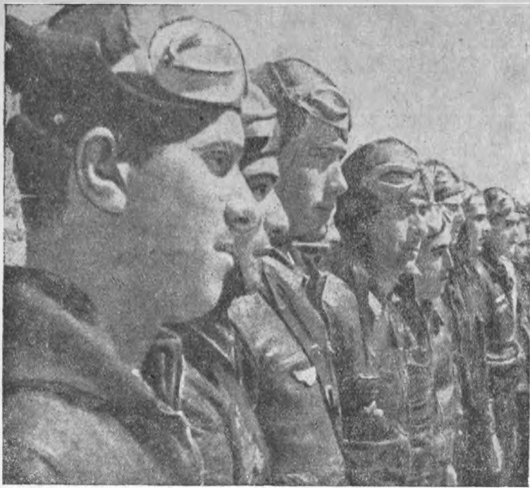
Героические испанцы—летчики республиканской авиации одерживают победы в боях против авиации итало-германских интервентов на фронте Эбро.

На снимке—летчики республиканской авиации