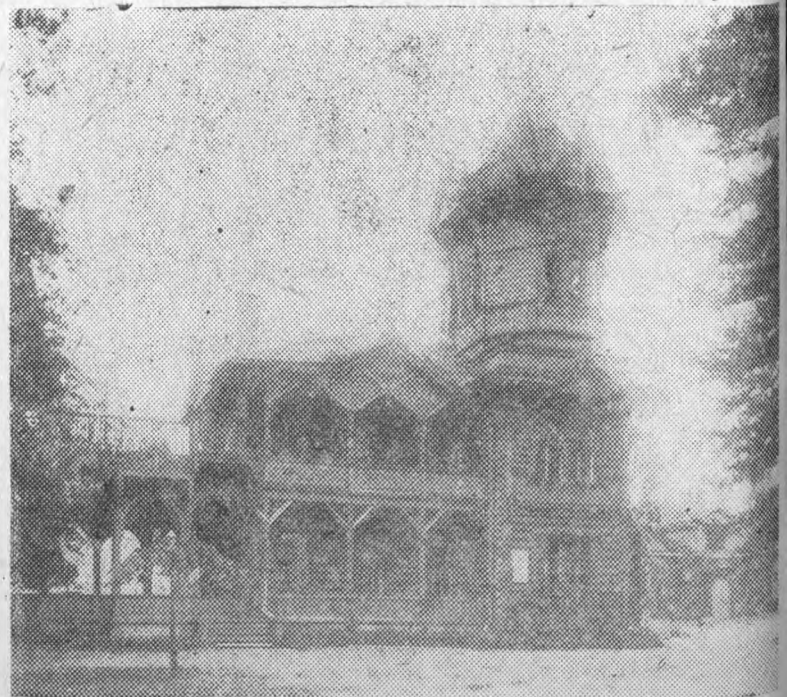
Дом № 13 по Балатной ул. (Лесной), в котором 29 (16) октября 1917 г. состоялось расширенное заседание ЦК большевистской партии. 29 (16) октября была принята предложенная В. И. Лениным резолюция о вооруженном восстании и выбран во главе с И. В. Сталиным Партийный центр по руководству восстанием