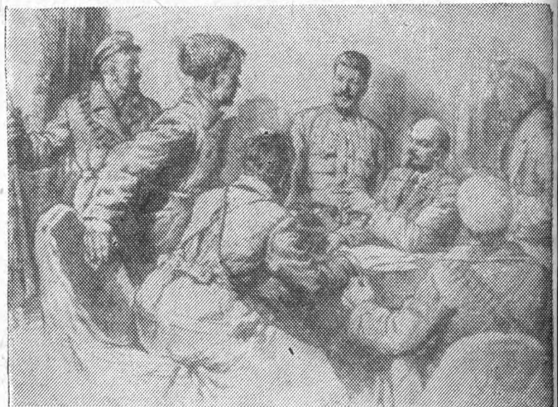
„В. И. Ленин и И. В. Сталин в Смольном“ (рисунок худ. Ю. Непринцева)

большевиков, стал боевым штабом революции, откуда шли боевые приказы.