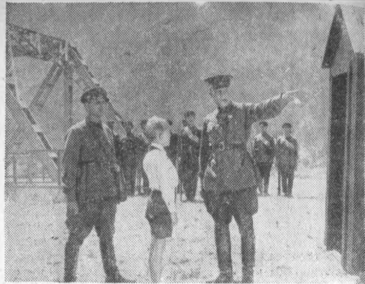
Ленинградская ордена Ленина киностудия „Ленфильм“ в ближайшее время выпускает новую картину „На границе“, по мотивам Н. Павленко. Режиссер фильма—Александр Иванов.

12 ноября—культпоход на пьесу „Очная ставка“.