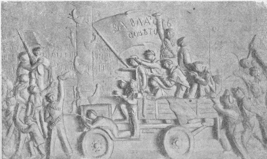
Барельеф — „Матросы в Октябрьские дни 1917 г. на Биржевой площади“ Скульптор Я. А. Труупянский