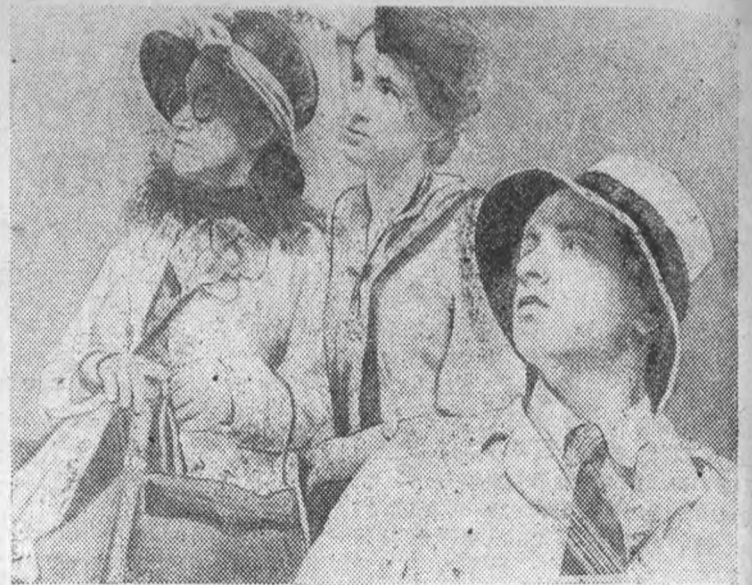
23 ноября в клубе ученых ЛИИ детьми научных работников и преподавателей была поставлена пьеса „Мистер Твистер“