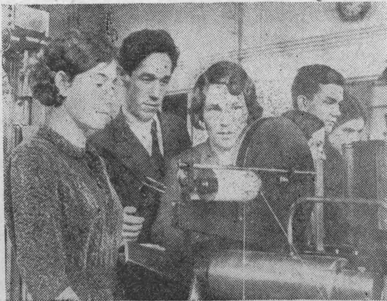
Студенты 203 гр. инженерно-экономического факультета проводят испытание на сжатие на машине Амслера