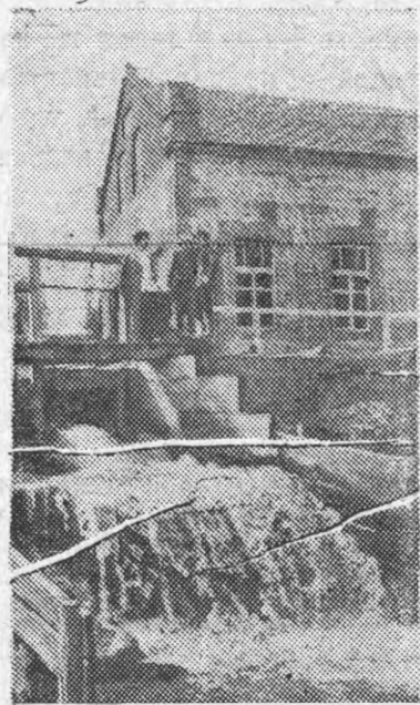
Гидроэлектростанция колхоза „Южный красный партизан“ на реке Терек