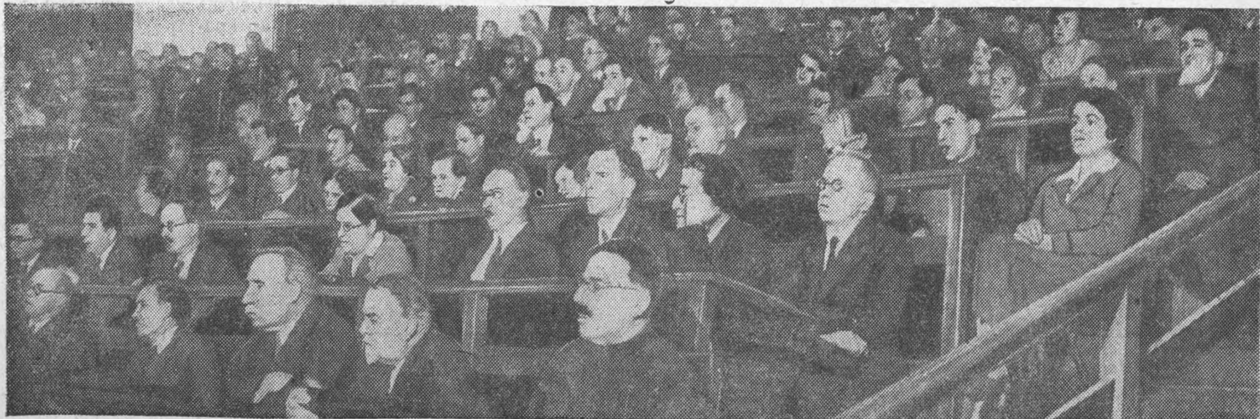
Партийный комитет института организовал цикл лекций для профессоров и преподавателей, индивидуально изучающих историю ВКП(б). Будет прочтено 17 лекций по основным разделам истории партии. Кроме того, в целях организации товарищеского обсуждения ряда важнейших вопросов истории партии, будут проведены две теоретические конференции.