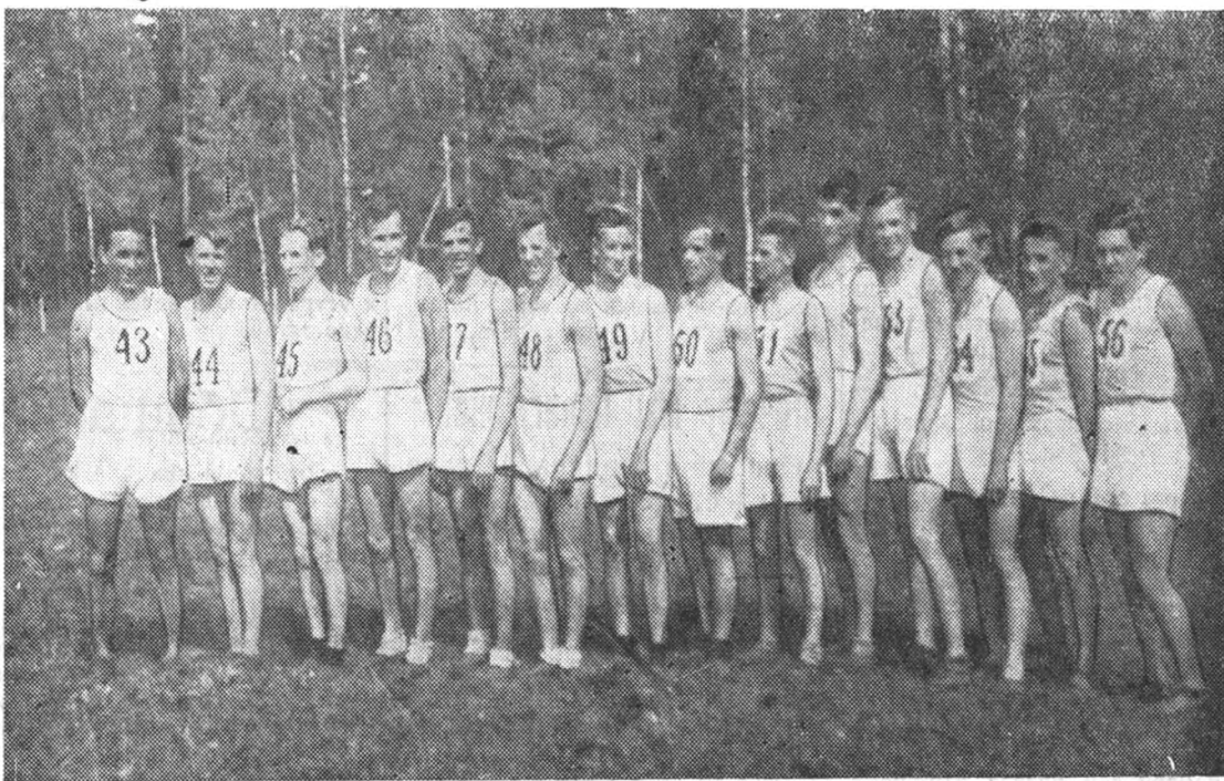
Мужская команда бегунов ЛИИ, занявшая 2-е место в кроссе „Спартак“

Самой интересной встречей по группе Б была встреча футболистов механического факультета с металлургами. Результат 2:1 в пользу команды механического факультета. Н. К.