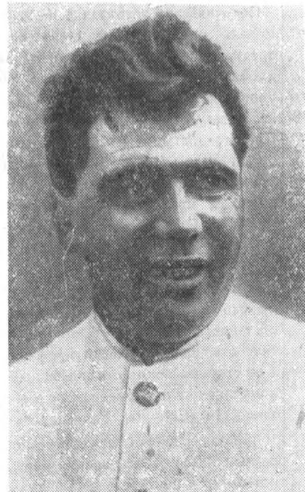
Герой Советского Союза тов. М. В. Водопьянов, 1-й пилот флагманского самолета „СССР Н-170“, командир звена тяжелых самолетов экспедиции советских полярников на Северный полюс. Тов. Водопьянов первый летчик, совершивший посадку самолета на Северном полюсе