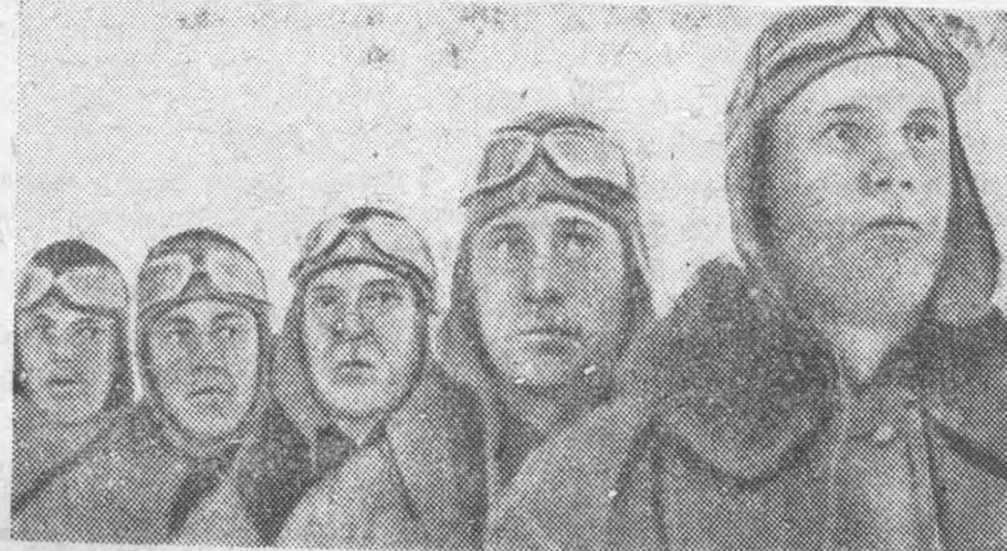
«Кто силен в воздухе, тот вообще силен» (ВОРУШИЛОВ)

Треугольник группы УТИКОВ, КАЛИНИН, КУЗНЕЦОВ