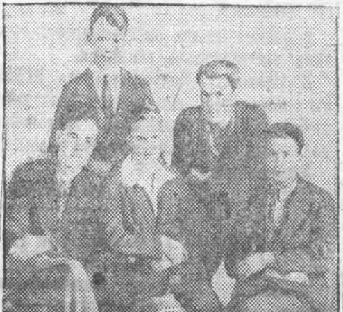
Бригада высокого качества — 272 гр. ОТФ.