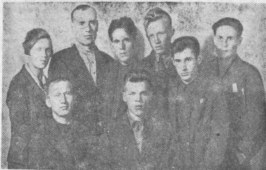
Лучшее комсозвено ЭСФ 412 гр. Средняя оценка за прошлый семестр — 4,55