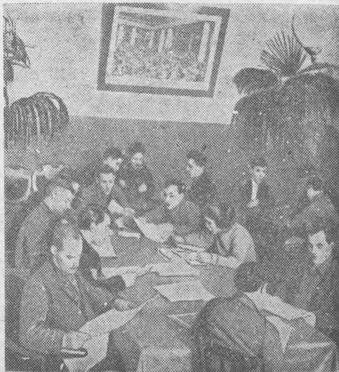
В одном из красных уголков ЛИИ