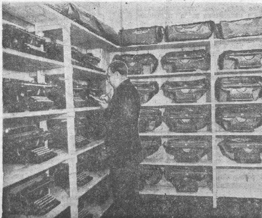
НАКАЗ ЛЕНСОВЕТУ. Форсировать строительство завода пишущих машин. ВЫП ЛЕНИЕ НАКАЗА Завод пишущих машин (ст. Лигово). Склад готовой продукции

Наказ. Организовать студенческую базу 5-го дня отдыха, увязав ее работу