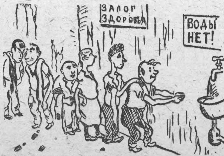
(Эту картинку можно частенько видеть в общежитиях нашего института)