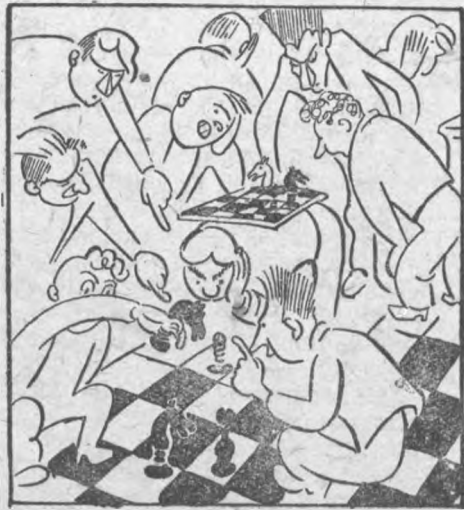
Подготовка на полном ходу

В ЛИИ скоро начнутся внутригрупповые шахматные соревнования