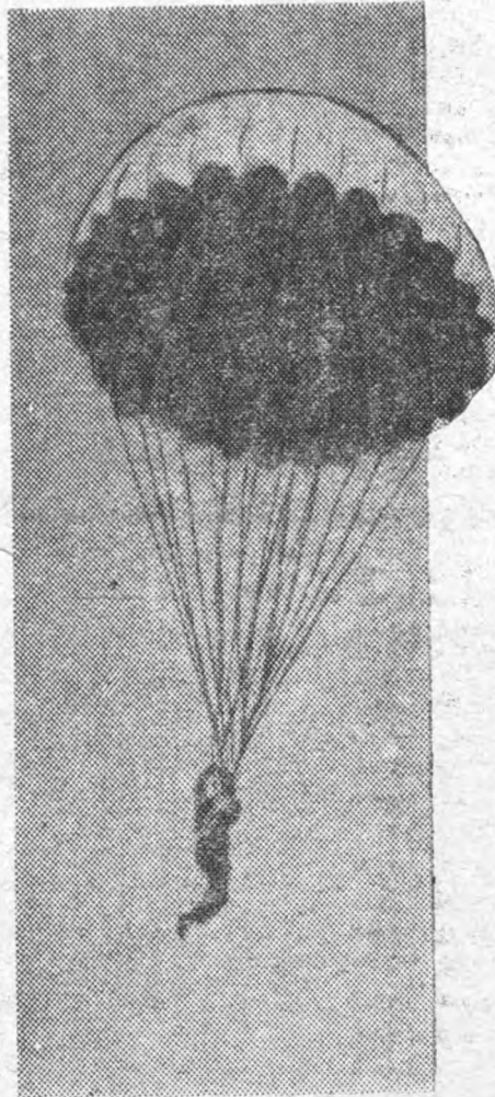
Прыжок с парашютной вышки.

Если со сдачей норм на ГТО среди комсомолок дело обстоит и не плохо, то со сдачей всеобщей молодежи крайне безобразно.