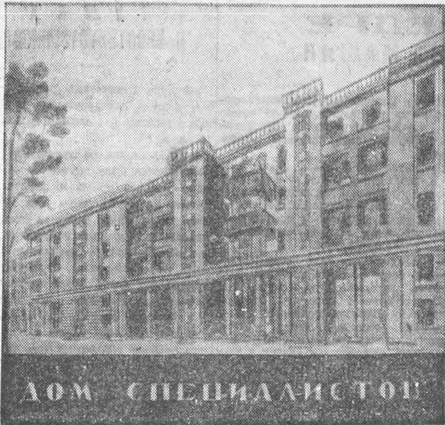
Проект дома специалистов Ленинградского Индустриального института