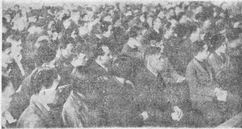
Слушают выступления в прениях

всего 3 ворошиловских стрелка, причем двое из них бывшие военнослужащие, следовательно, по существу поток подготовил лишь одного ворошиловского стрелка, а наш поток как образцовый по оборонной работе был показан на страницах «Индустриального». Кампанейское отношение к оборонной работе должно быть сегодня окончательно изжито, — заканчивает свое выступление тов. Володенко.