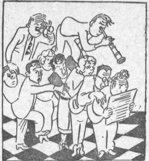
— Ур-р-ра! Кажется, что-то вижу...

БОЛЬШАЯ РАДОСТЬ В лаборатории общей физики мало описательных таблиц к работам, а имеющиеся пришли в такое состояние, что их чтение становится затруднительным.