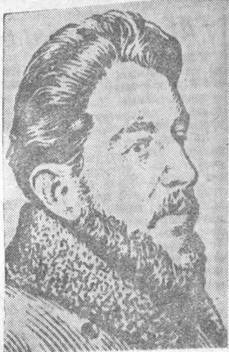
Евгений Левинэ — вождь Баварской коммуны

Образ этого героя исключительно ярко выведен в повести ленинградского писателя Слонимского «Повесть о Левинэ», которая в ближайшем времени выйдет из печати.