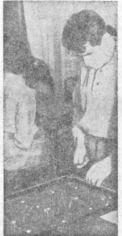
Китайский бильярд пользуется успехом