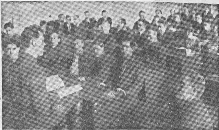
Проработка наказа профкому ЛИИ в секции конференции.

В целях лучшей связи и быстрого ответа на заметки, редакция газеты «Индустриальный» просит студюков и всех пишущих в газету четко подписывать свою фамилию и указывать точный адрес.