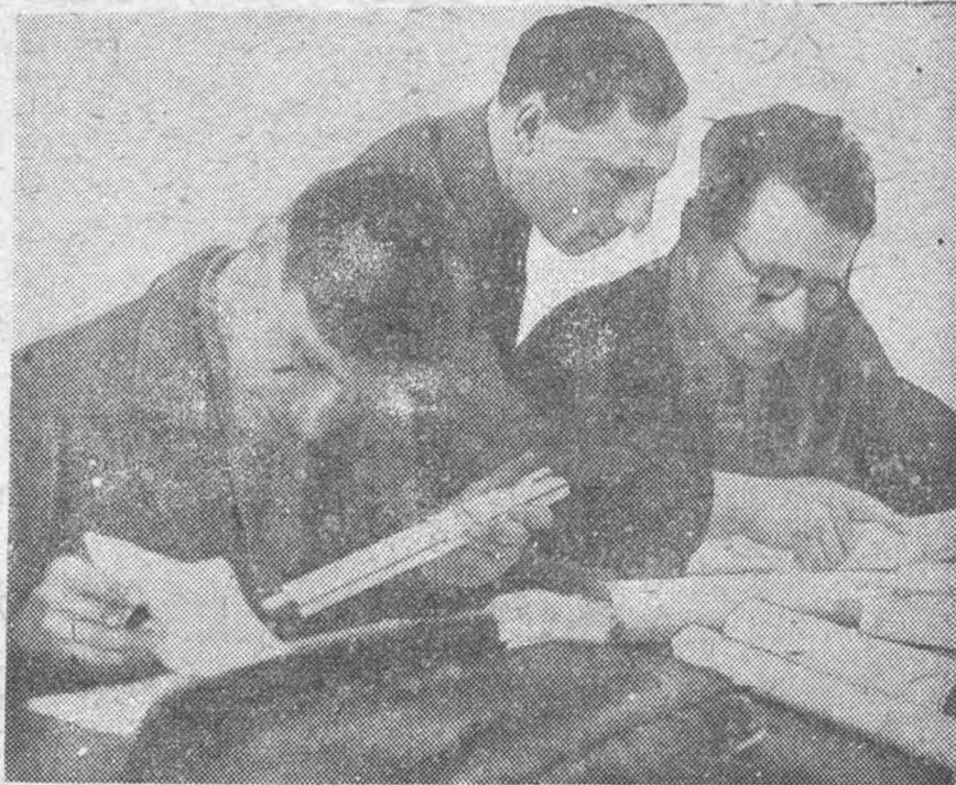
Готовятся к сессии.