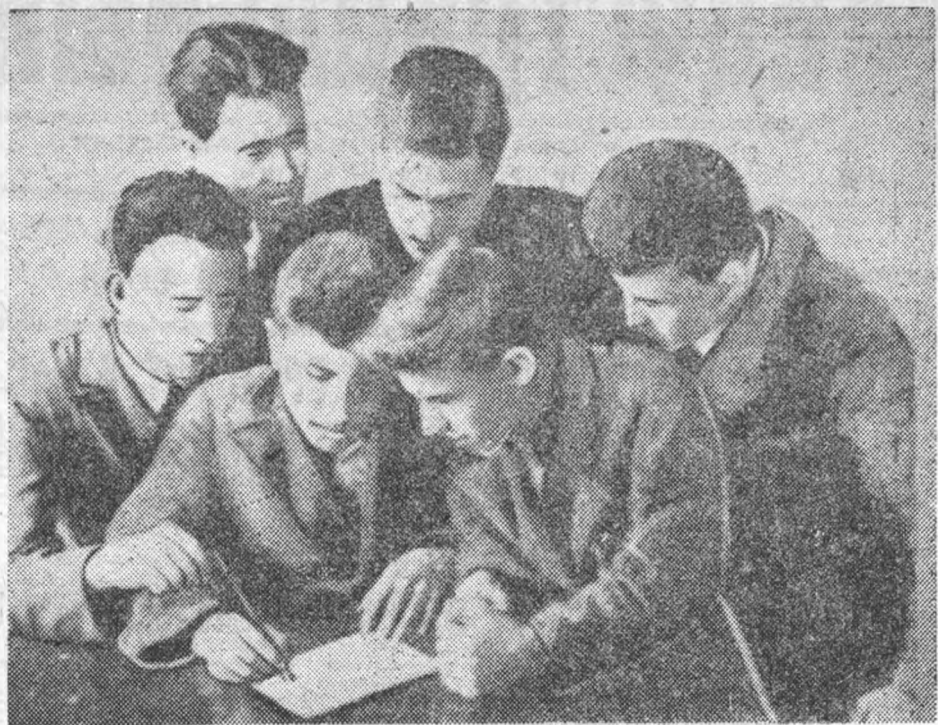
Студенты металлургического ф-та проводят подписку