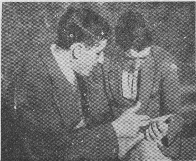
Перед зачетом просматривают материал