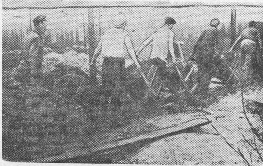
Доставка материалов и строительству.