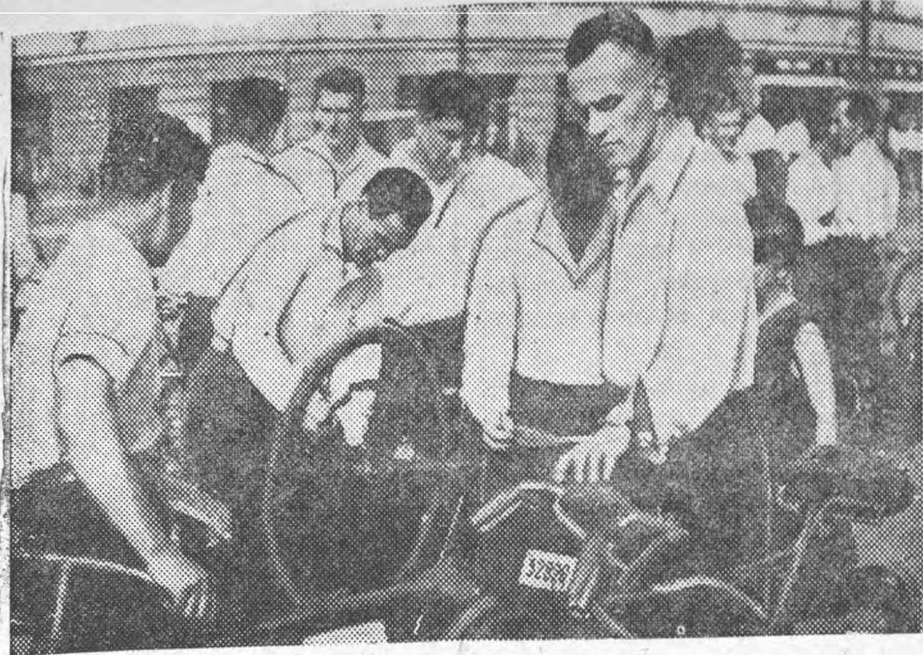
Студенты ЛИИ перед вело-вылазкой