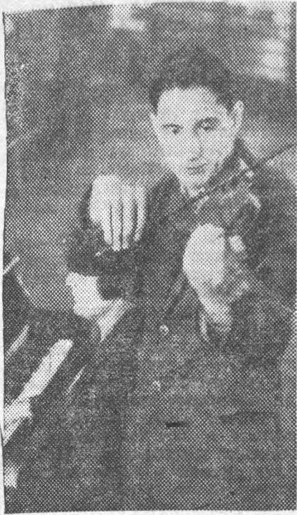
На институтской олимпиаде