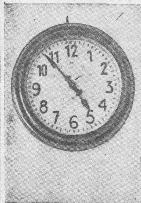
как украшение. Круглые сутки без семи пять.