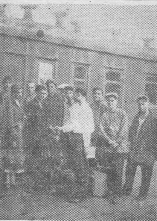
4. Встреча на вокзале.