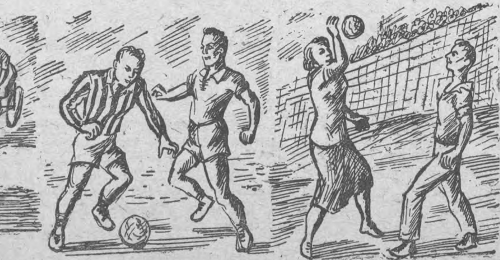
О ТОЛЬКО В ПЛАНЕ

Бесспорно, что большую организующую роль должны сыграть старосты комитетов своим личным примером организованности, культурности и широкой молодежной инициативы.