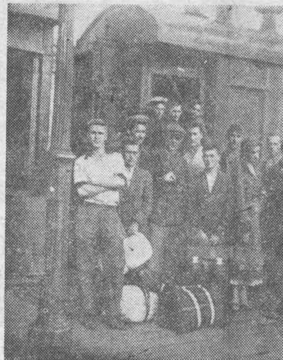
Луганцы приехали. Встреча