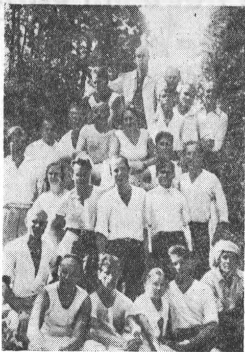
Группа студентов ЛИИ, отдыхающих в санатории «Красный вал»