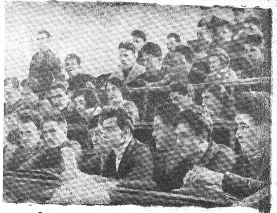
... Сильно омолодился состав студенчества ЛИИ за три года...