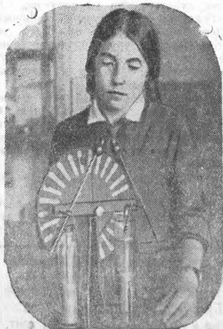
Ученица 8 кл. 1-й средн. школы тов. Голубинцева — отличница, общественница — в физическом кабинете.