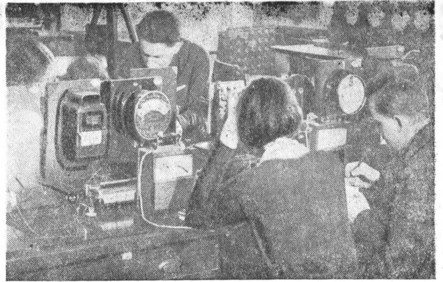
В лаборатории электронизмерений