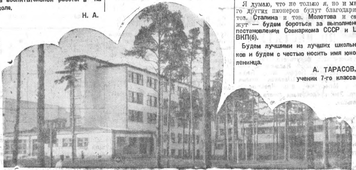
Наша подшефная первая средняя школа в Лесном