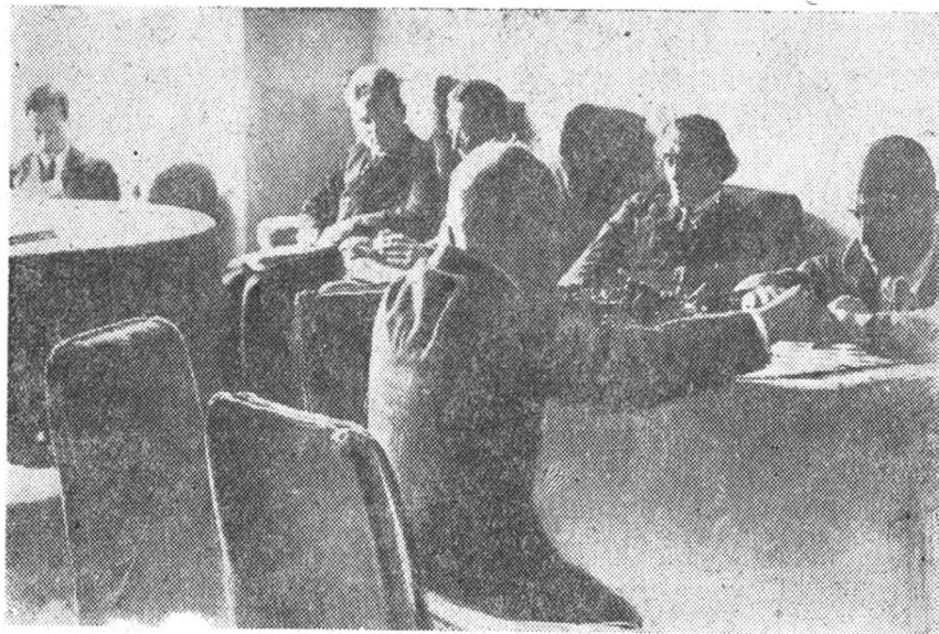
В преподавательской комнате главного здания в перерыве