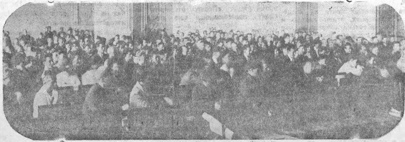
На комсомольском собрании общетехнического ф-та