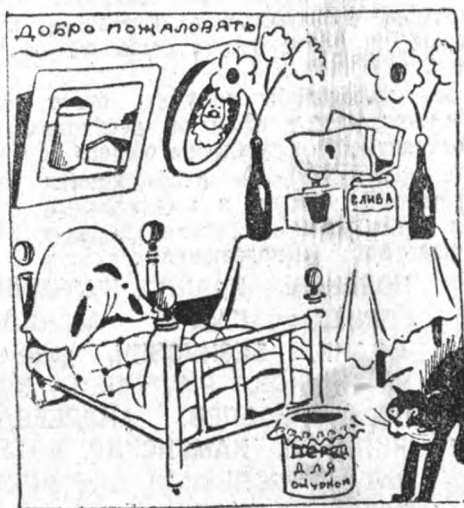
«...Подушка сделана, как египетская пирамида»

Вид комнаты от этих простеньких вазочек с астрами и георгинами очень выигрывал, а это собственно и беспокоило Сею. Ведь договор соцсоревнования, заключенный между комнатами Сеи и Зины, мог быть решен не в его пользу.