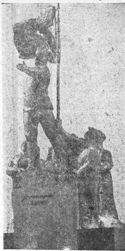
Один из проектов памятника С. М. Кирову