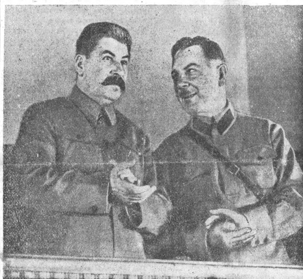
Товарищ СТАЛИН и товарищ ВОРОШИЛОВ на 1-м Всесоюзном совещании стахановцев