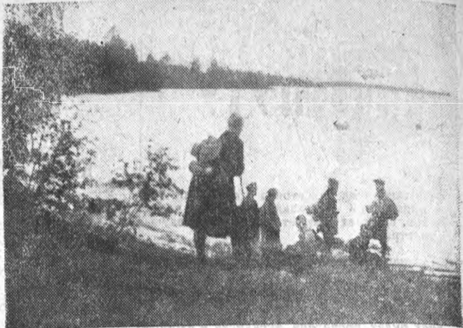
Группа наших студентов-гидротехников на берегу Сун-озера в Карелии