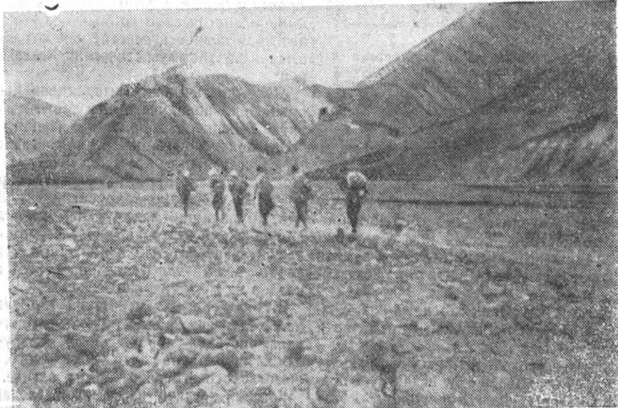
Группа туристов-студентов ИФФ в долине Терека (Кавказ)

ства по отношению к спутникам и одновременно прививают важнейшие военно-прикладные навыки.