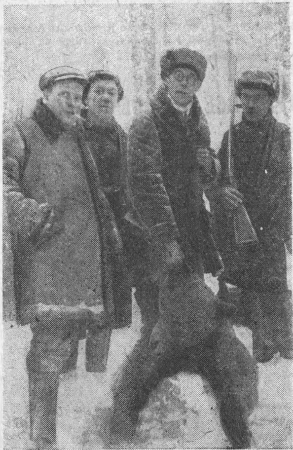
В марте в один из выходных дней охотничья секция союза охотников ВУЗ и НИУ организовала охоту на медведя под Ленинградом.

Охота была удачной—медведь был убит. Взяли еще живыми двух медвежат.