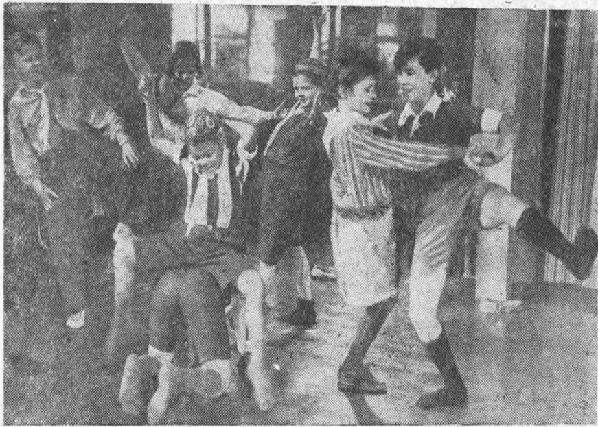
На фото—кадр из фильма