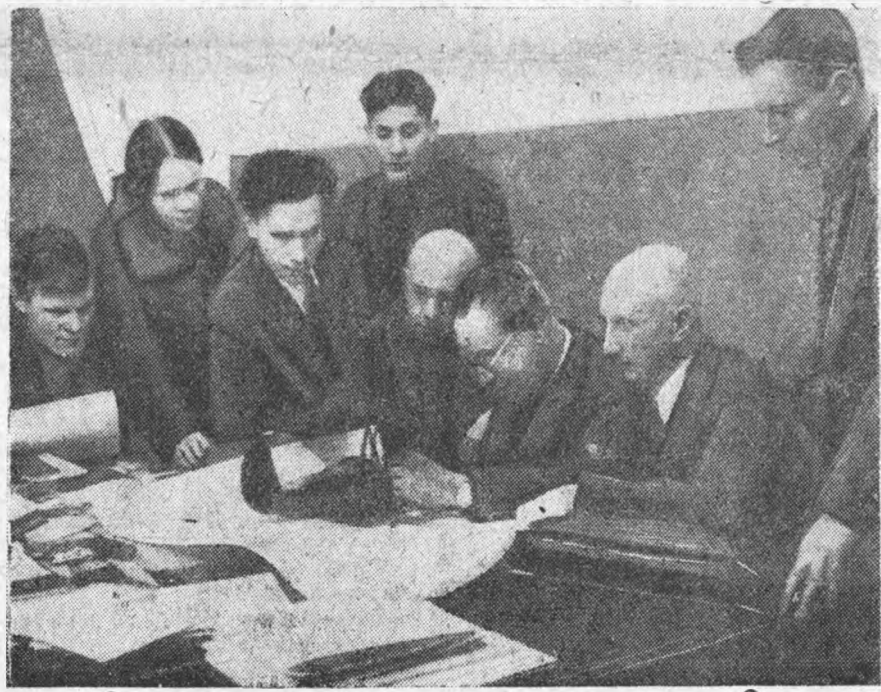
Инициативная группа ЛИИ по постройке авиэтки „Пионер“ в честь X съезда ВЛКСМ обсуждает модель авиэтки