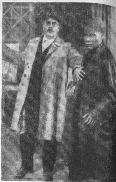
Кадр из нового звукового фильма