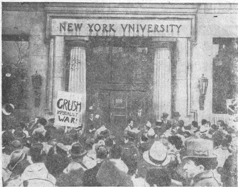
На снимке—митинг студентов перед зданием нью-йоркского университета. На плакате лозунг: «Уничтожьте империалистическую войну»