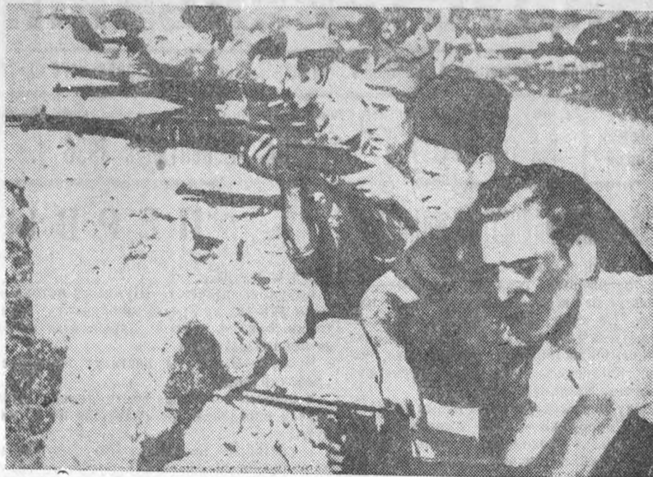
Отряд рабочей милиции обстреливает мятежников