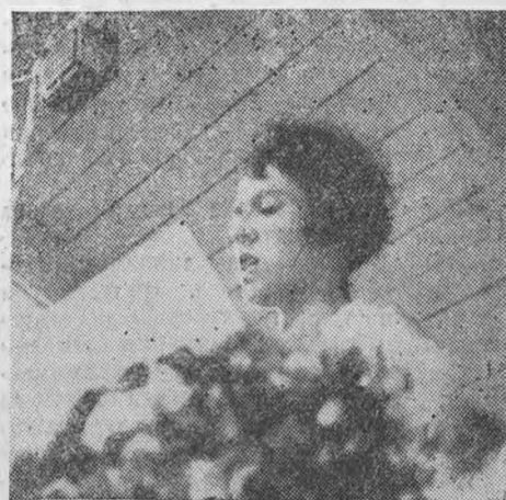
Лучшая гимнастка ЛИИ тов. Дедова читает приветствие народному комиссару тяжелой промышленности товарищу Орджоникидзе