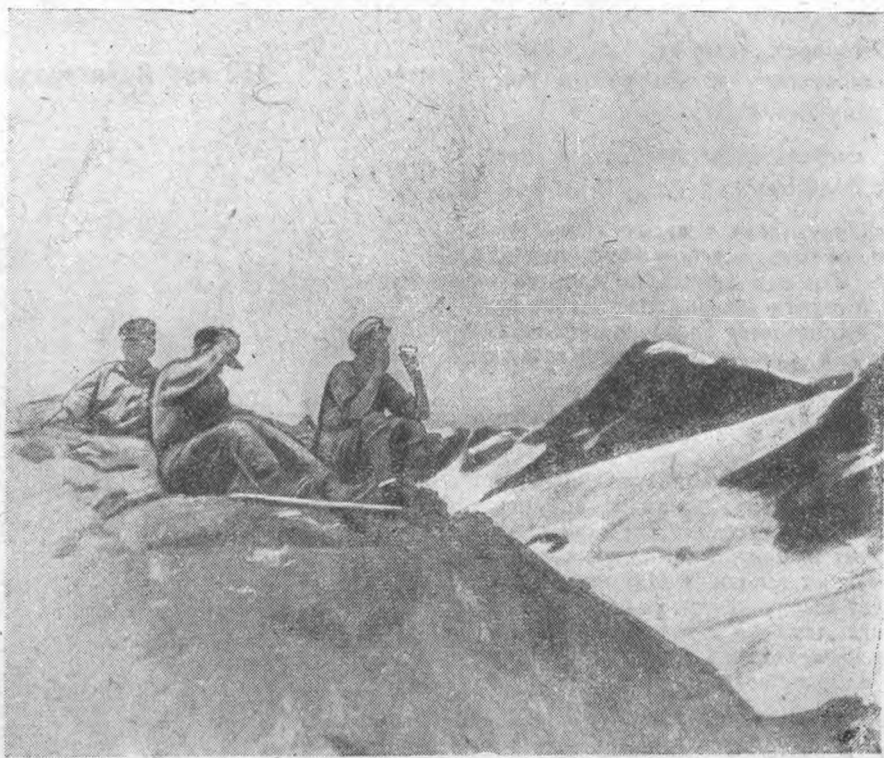
Завтрак альпинистов при восхождении на Эрцог (3868 м)

Мы прошли 5 ледников, на протяжении 19 км. наш путь следовал по моренам и фирну. Глаза приходилось защищать от ослепительного солнца дымчатыми очками. Спустившись по другую сторону Главного Кавказского хребта мы оказались в Верхней Сванетии.