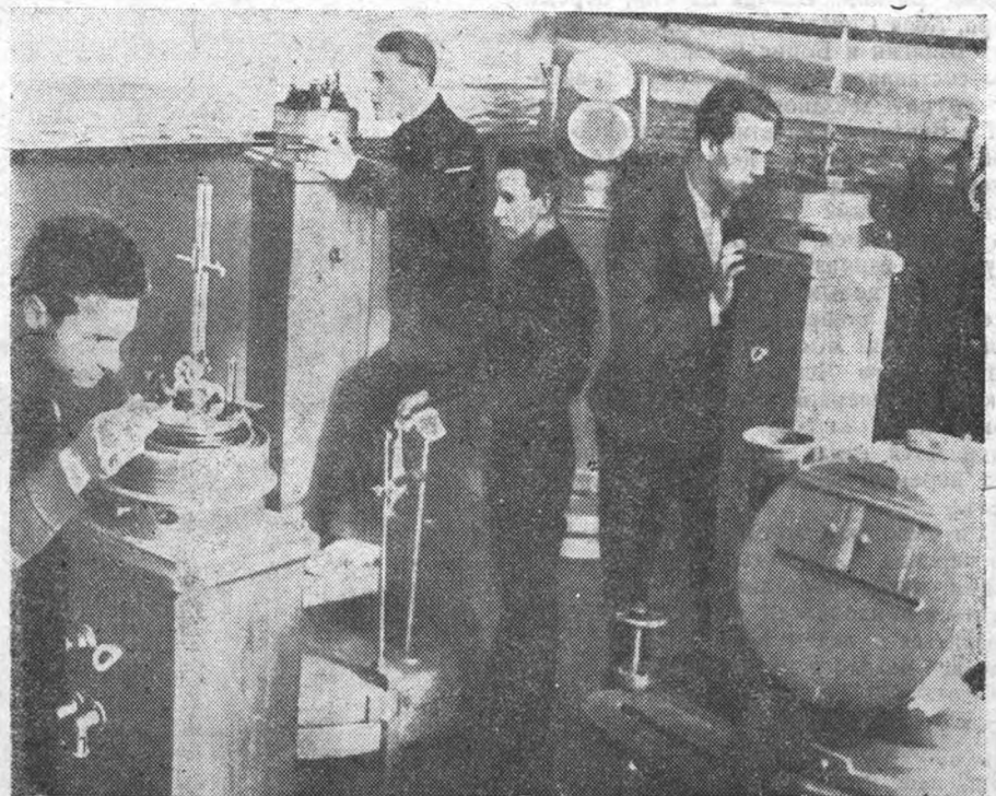
Основанный в 1786 г. Ленинградский Морской техникум вырос в крупнейшее средне-техническое учебное заведение, готовящее кадры по следующим специальностям: радио-техническая, электро-механическая, судоводительская, судомеханическая и механизаторов портов. Ежегодно техникум выпускает до 300 человек.