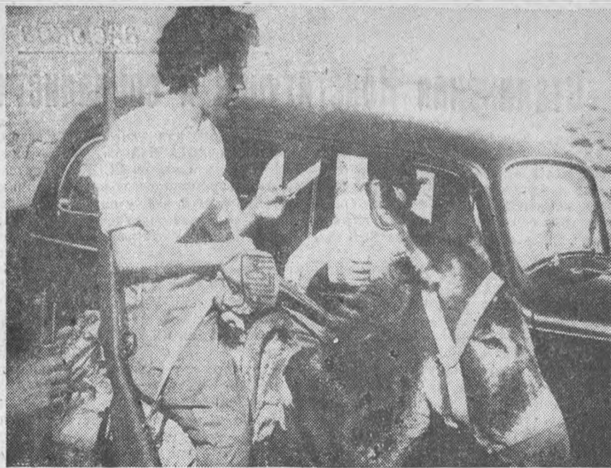
Женщина-боец правительственных войск проверяет документы автомобилиста в окрестностях Мадрида