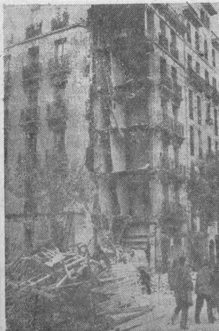
Вид с мизтажного здания в западной части Мадрида, стена которого разрушена бомбами фашистской авиации

раются грани между рабочим классом и крестьянством и между этими классами и интеллигенцией; у нас стираются* экономические и политические противоречия между этими социальными группами.