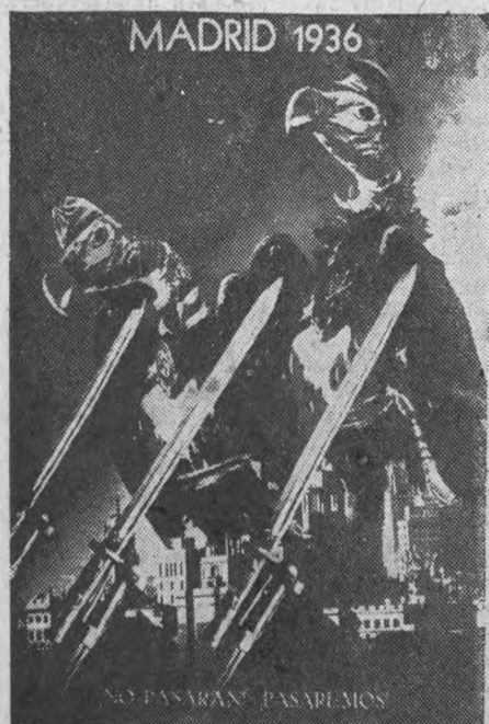
Фотомонтаж Джона Хартфильда из журнала „Фолкс-Иллюстрирте“ (Прага от 25 ноября 1936 г.). „Они не пройдут. Мы пройдем“