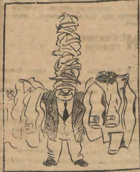
Как дирекция института представляет себе вешалку для студентов

Один медицинский случай произошел у нас в Индустриальном институте.