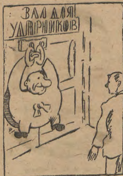
Картинка без слов. Все понятно, комментарии не требуются.

Приходят ударники и удивляются. Не удивляется только пом. заведующего столовой: