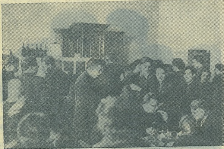
На снимке: во время перерыва в буфете...

М-49080 Заказ № 1455 Типография им. Володарского Ленинград, Фонтанка, 57