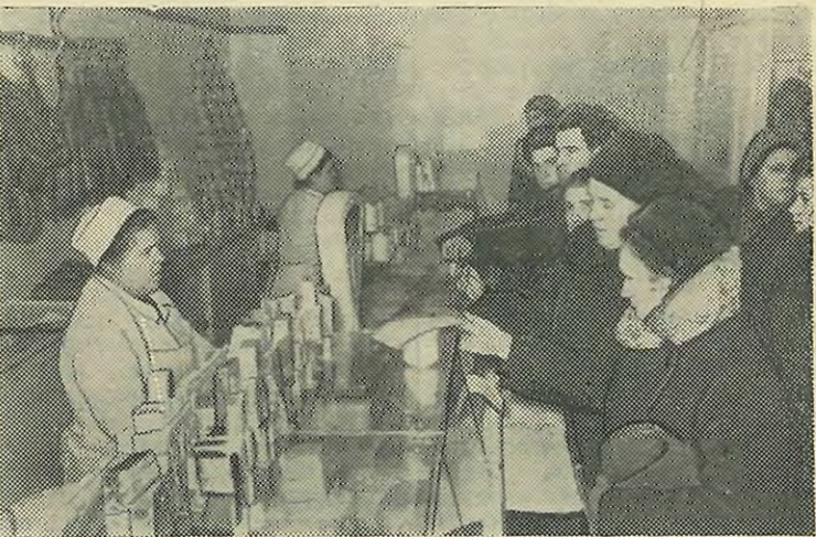
Выборгская сторона. На снимках: сверху — новый дом на проспекте Карла Маркса, построенный по проекту архитекторов В. Ф. Белова и А. В. Гордеевой. Внизу: в доме № 74 по проспекту Карла Маркса открылся новый магазин молочных продуктов и гастрономии.

новлена плотина. Благоустроены три пляжа, очищены берега и дно озера.