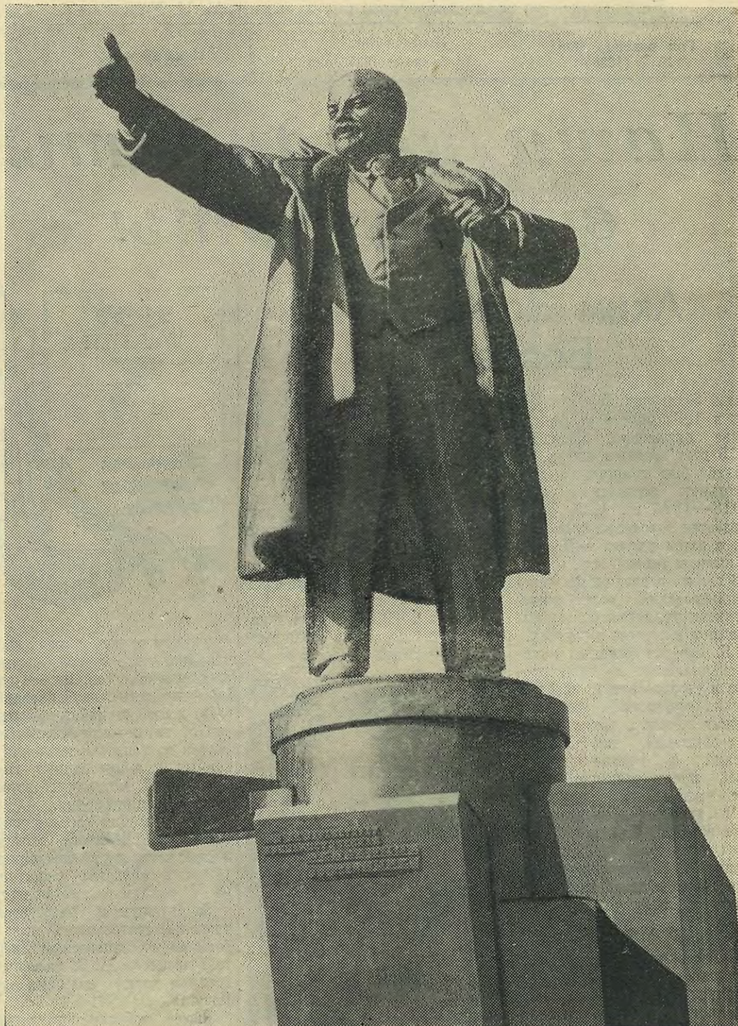
Выборгская сторона. На снимке: памятник В. И. Ленину у Финляндского вокзала.

1917 год. Рабочий класс под руководством Коммунистической партии взял власть в свои руки. С этого времени стал, сначала незаметно, медленно, а затем все быстрее и ошутимей, меняться облик нашего района. Вот почему вы не должны забывать о том, как жили ваши отцы и деды, вот почему вы, молодые люди, перед которыми открыты все дороги в большую счастливую жизнь, должны знать, что вы опустите свои бюллетени 3 марта за родную Советскую власть, за Коммунистическую партию, которой мы всем обязаны. Не забывайте этого. Вы живете в светлое время.