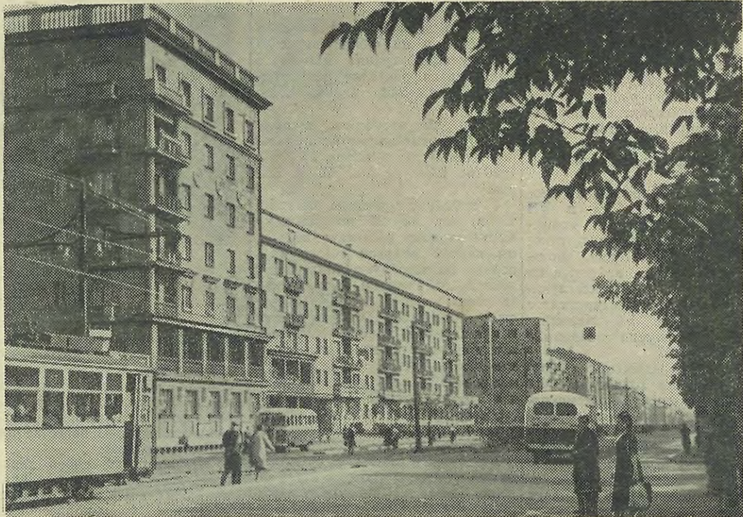
Выборгская сторона. На снимке: в наши дни на Лесном проспекте.

Творческая самодеятельность трудящихся Сталинского района, их забота о сохранении и дальнейшем озеленении садов и парков, о сбережении жилых домов принесли и принесут существенную пользу, избиратели помогут сделать Выборгскую сторону еще краше, богаче, наряднее.