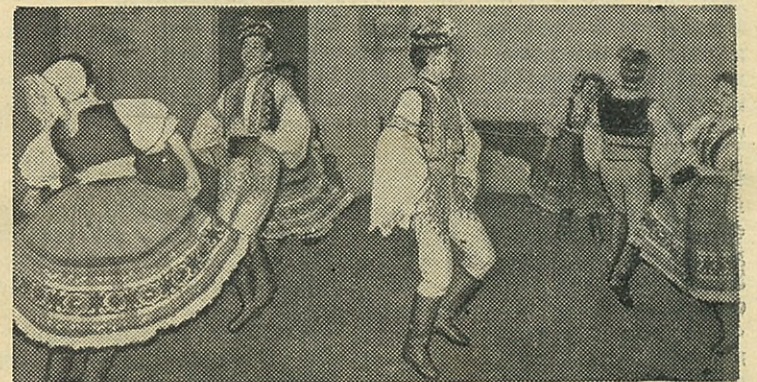
На снимке: выступление хореографического коллектива.

Б. НИТОВИЧ, председатель спортклуба «Политехник»