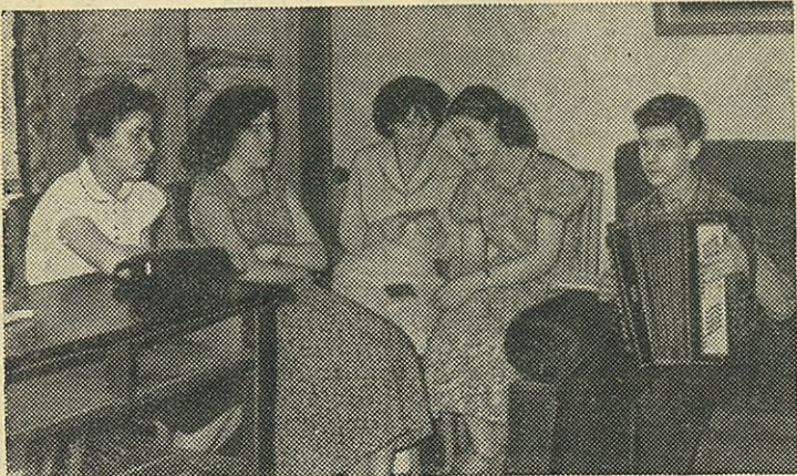
Девушки репетируют русскую народную песню «Грушенька».

тория Белоносова — выпускать в колхозах цветную световую газету. Для этого необходимо достать специальный проектор. Световая газета имеет большие возможности и в колхозах бу-