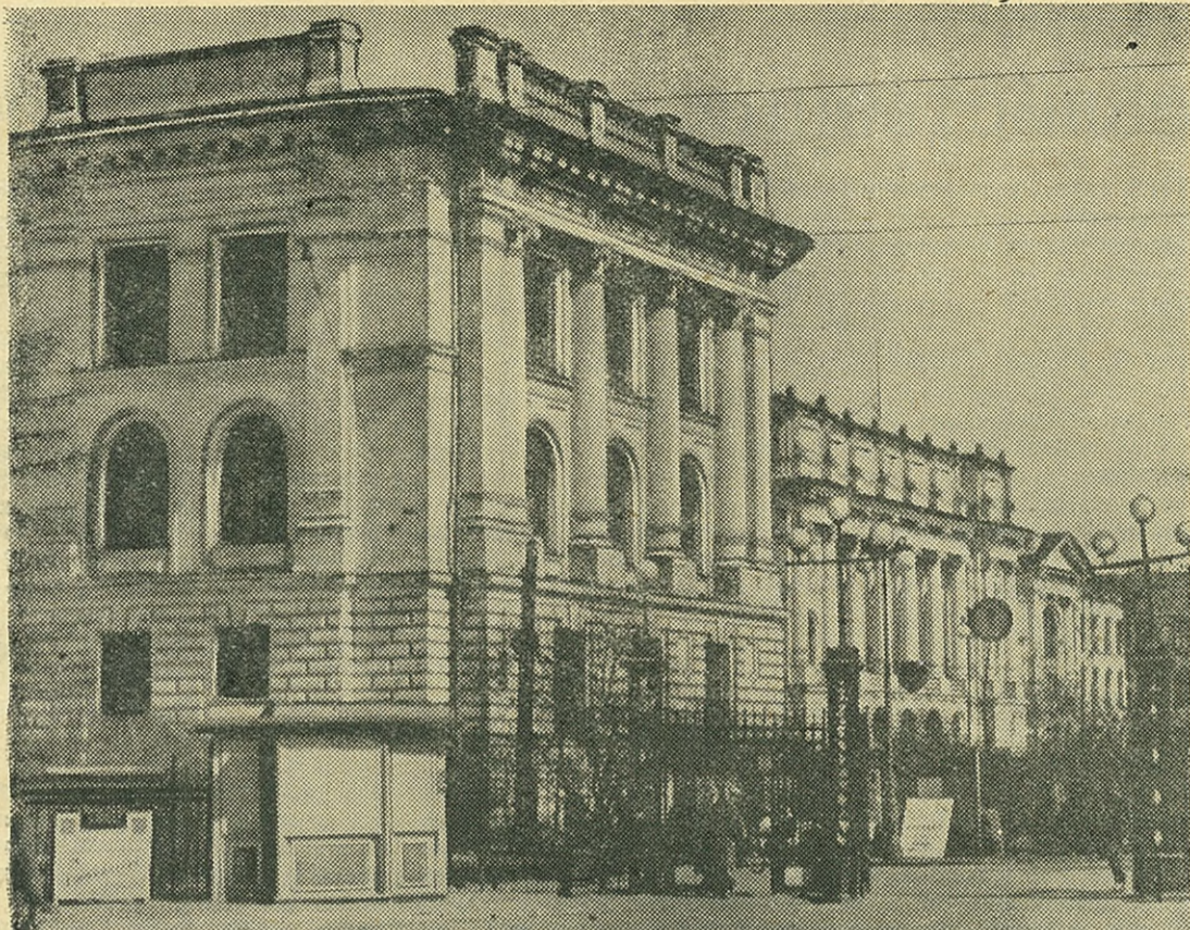
НА СНИМКЕ: Главное здание Ленинградского политехнического института им. М. И. Калинина.

Орган парткома, дирекции, профкома и комитета ВЛКСМ Ленинградского политехнического института им. М. И. Калинина