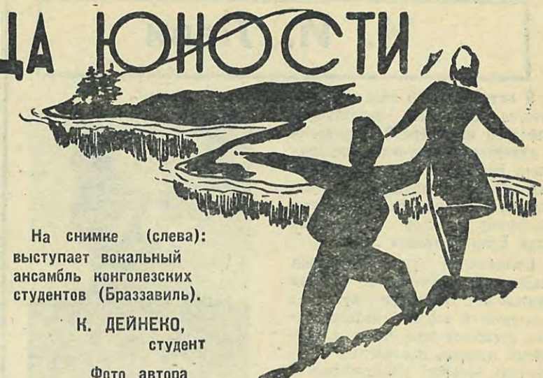
На снимке (слева): выступает вокальный ансамбль конголезских студентов (Браззавиль).