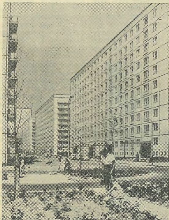
На снимке: новые дома в Берлине.