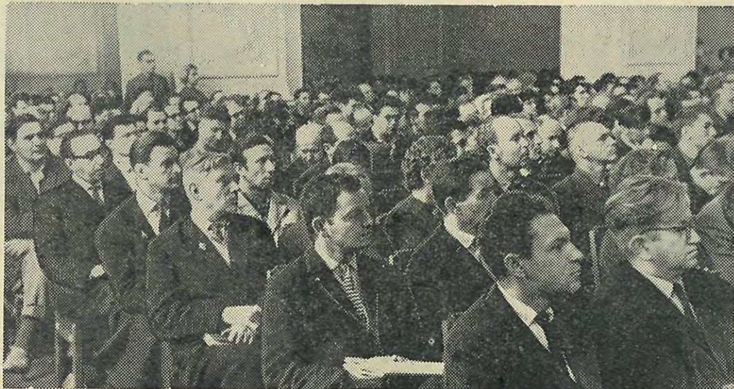
В актовом зале во время собрания.