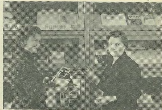
Отдел учебной литературы фундаментальной библиотеки получил переходящий вымпел за хорошую работу.