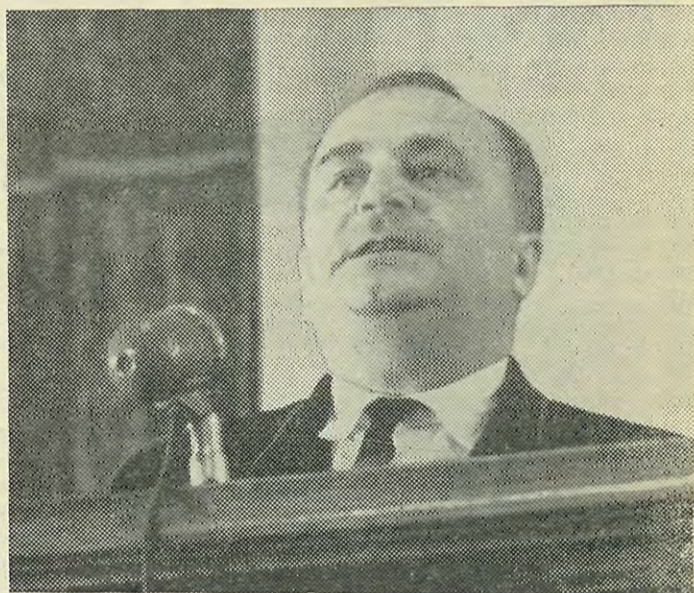
На трибуне ректор ЛПИ, член-корреспондент АН СССР, заслуженный деятель науки и техники РСФСР, профессор В. С. Смирнов.

Выходит с 22 апреля 1926 года Цена 2 коп.