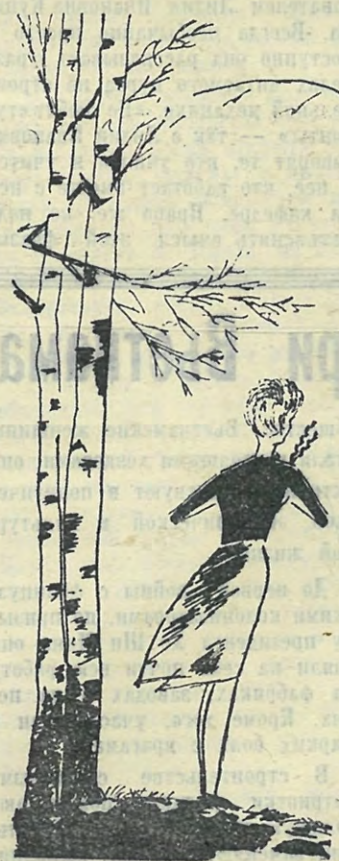
Рис. С. Кривоногова