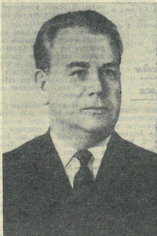
Политехнический избирательный округ № 99 КИРИЛЕНКО Андрей Павлович

На XX и XXII съездах партии А. П. Кириленко избирали членом ЦК КПСС. С 1957 по 1961 год он кандидат в члены Президиума ЦК КПСС, а с 1962 года —