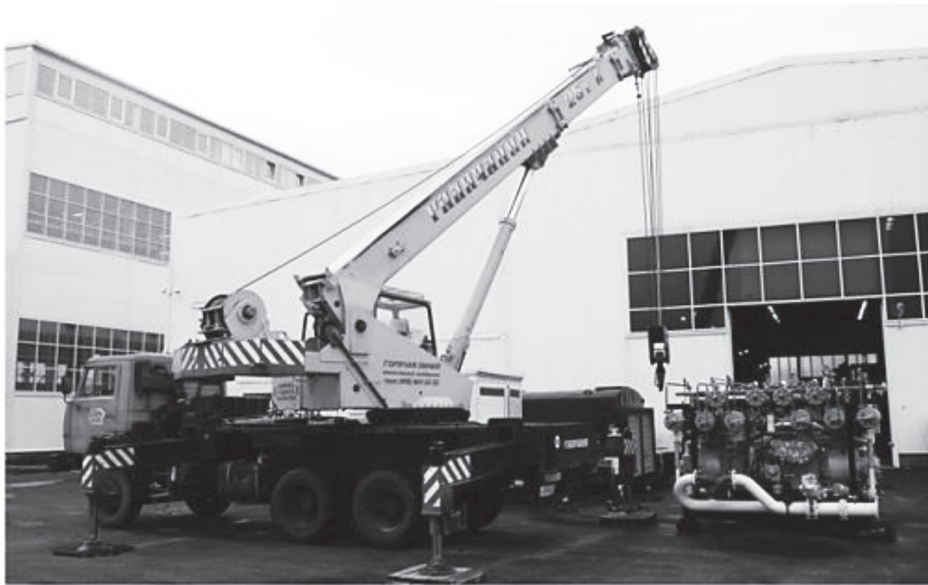
Рис. 3. Погрузка углекислотной компрессорной установки производства ККЗ

углекислоты. Обычно такие установки используют углекислый газ, получаемый в результате процессов брожения, сбора и утилизации дымовых газов котельных либо сжигания газа в специальном генераторе. Установки смонтированы на раме без корпуса – это обеспечивает высокую экономичность и эффективность работы, облегчает обслуживание. УВЖС предназначены для использования внутри помещений и монтируются в цехах предприятий заказчиков. Продукты, производимые на таких установках – это жидкий углекислый газ для последующего розлива в баллоны и сухой лед в блоках.