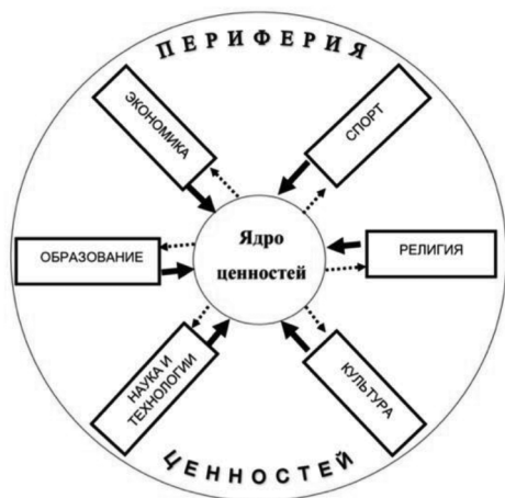
Рис. 1. Направление и сила влияния ядра ценностей в период массовых коммуникаций первого уровня

Таким образом, в ближайшее время мы станем свидетелями того, насколько влияние массовых коммуникаций средствами интернета и социальных