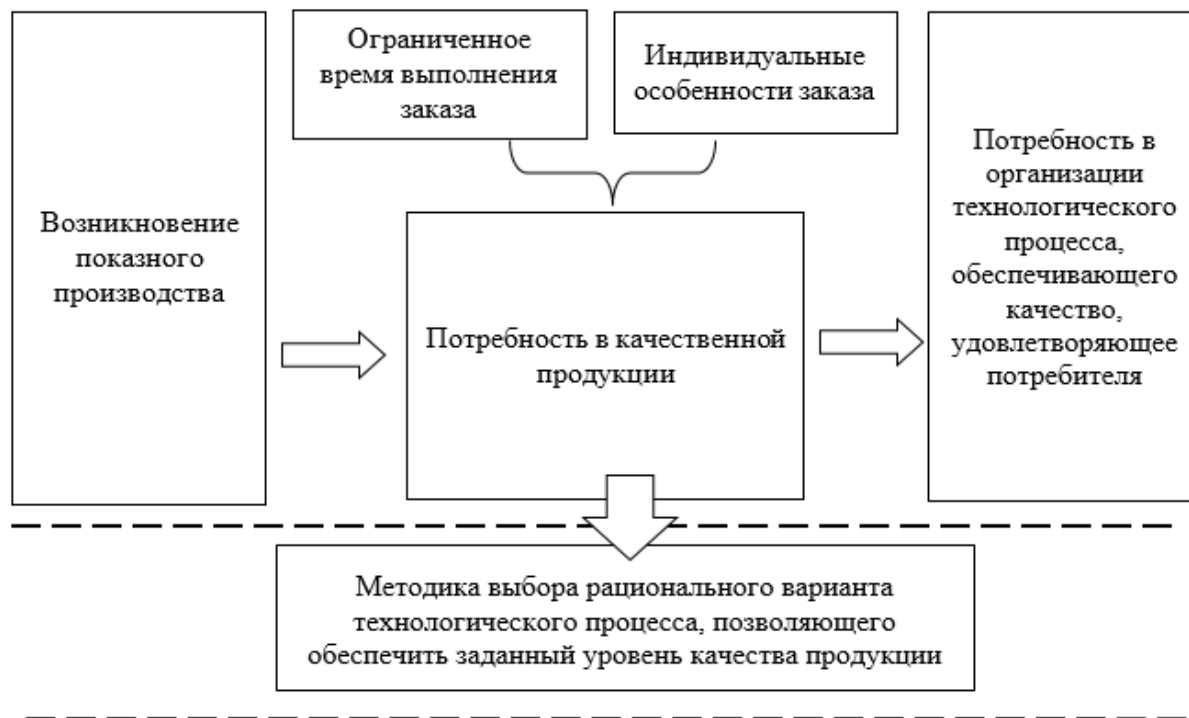
Рис. 1. Взаимосвязь понятий позаказного производства и качества технологического процесса

С появлением во внешней и внутренней среде предприятий новых условий и факторов, оказавших значительное влияние на процесс постановки продукции на производство, возникла система позаказного производства продукции [5-7]. В связи с этим возросла потребность в высоком качестве продукции, которая привела к необходимости обеспечить высокую организацию технологических процессов. Таким образом, для обеспечения постоянного повышения качества продукции необходимо постоянно повышать качество технологических процессов её изготовления [8]. Существующая в настоящее время методика поиска оптимальных вариантов технологических процессов для обеспечения заданного уровня качества машиностроительной продукции не учитывает особенностей позаказного производства и нуждается в улучшениях, которые будут учитывать современные условия формирования требований потребителей к качеству продукции. Взаимосвязь позаказного производства, качества технологического процесса и влияния методики выбора рационального варианта технологического процесса на качество продукции можно представить в виде схемы (рис. 1).