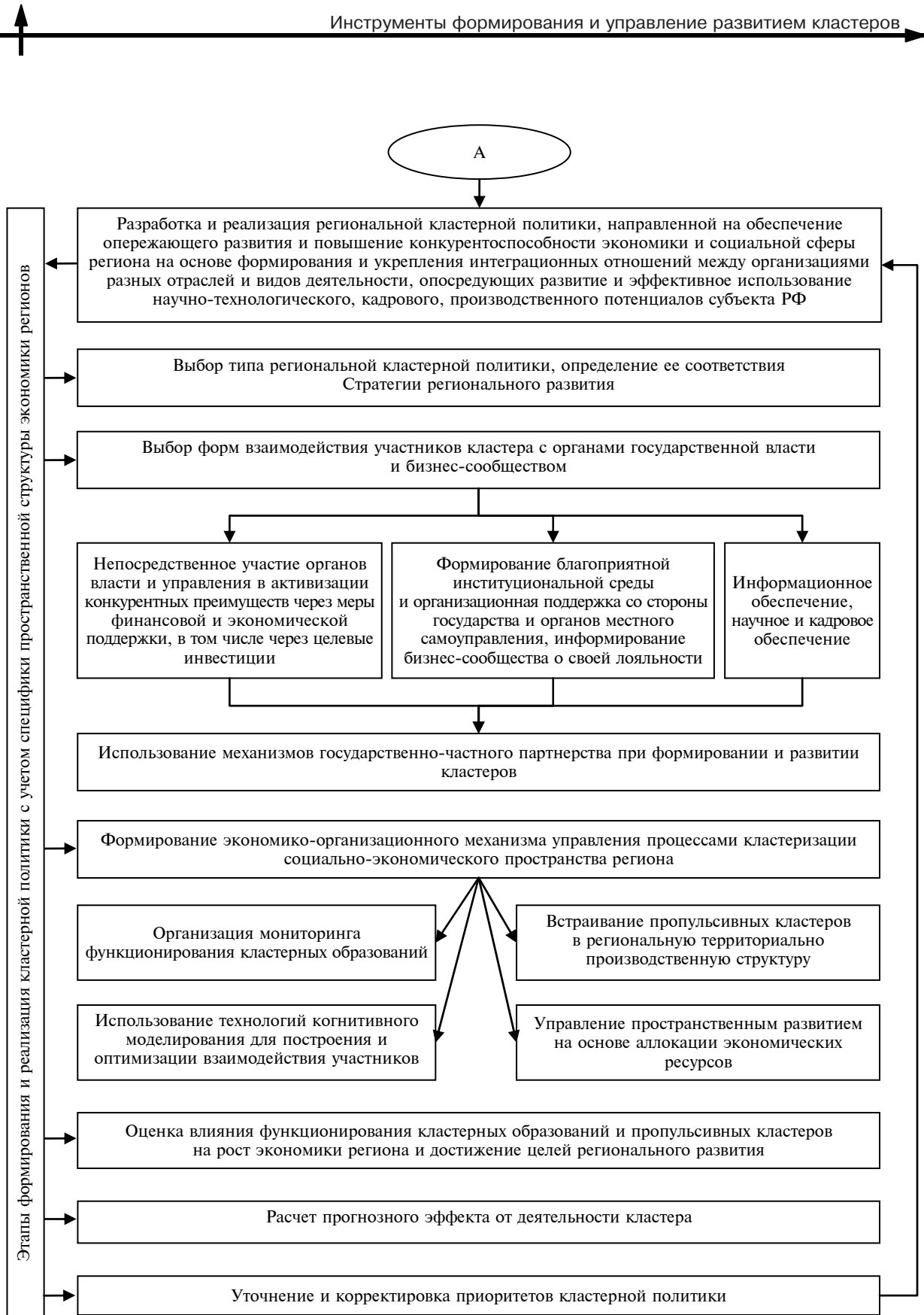
Алгоритм кластеризации регионального пространства и управления кластерным развитием