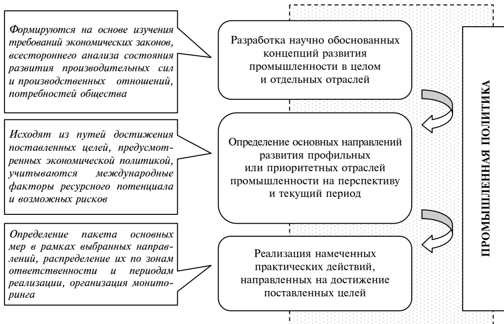
Рис. 1. Содержание промышленной политики

При появлении признаков, оцениваемых с позиции ресурсного потенциала и возможных рисков как существенные для конкурентоспособности территории, в рамках промышленной политики возможно проведение превентивных мер по изменению структуры экономики в соответствии с новыми потребностями. Тем самым промышленная политика также формирует структуру экономики территории, профильные и приоритетные отрасли, которые составляют ее конкурентный потенциал, предполагая стимулирование прямыми и косвенными мерами развитие их конкурентных преимуществ (рис. 1). В этом выражается селективный характер промышленной политики. Инициирование прогрессивных структурных сдвигов, направленных на обеспечение конкурентоспособности компаний, отраслей и национальной экономики в целом, отмечают в качестве приоритетной ее задачи многие ученые [5].