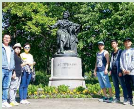
Поездка в Михайловское и Пушкинские горы помогла иностранным учащимся лучше понять творчество великого русского поэта