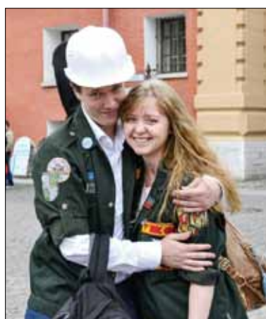
До скорой встречи!