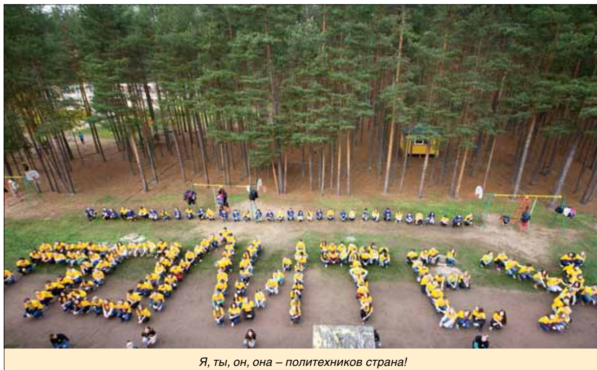
Я, ты, он, она – политехников страна!