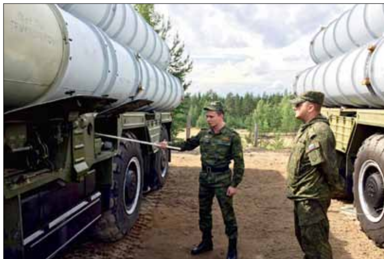
Курсант демонстрирует навыки эксплуатации современного зенитно-ракетного комплекса

Учеба в Политехе – это мир, наполненный позитивом, дружеским общением и яркими впечатлениями. В этом и заключается ее неповторимость.