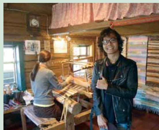
Удивительным стало знакомство с деревней Верхние Мандрог, где местные жители сохранили древние ремесла своих предков