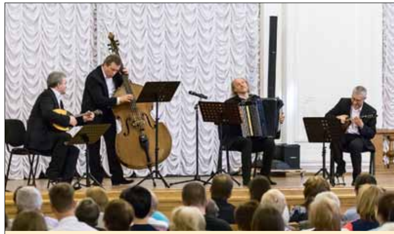
Ансамбль «Терем-квартет» выступал в Ватикане перед Папой Римским и на 3000-летию Иерусалима, на Олимпиадах в Ванкувере, Лондоне и Сочи и, конечно же, перед нашими политехниками

И еще возьмите на заметку. У вас есть дополнительный стимул учиться на «отлично» – лучшим из лучших выпадет счастливый билет – посетить Губернаторский новогодний бал, который тоже проходит в Белом зале. А теперь самое главное – все студенты Политехнического имеют право посещать концерты в Белом зале бесплатно.