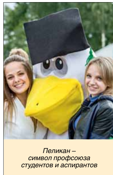
Пеликан – символ профсоюза студентов и аспирантов

По инф. Профсоюза студентов и аспирантов СПбПУ