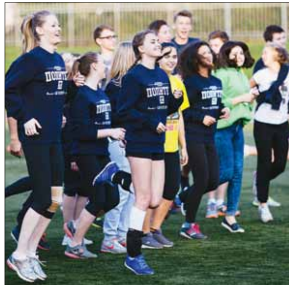
Бег на месте – общеприимяющий!

А еще активный и творческий, то тебя приглашает спортивный клуб «Политех», созданный в далеком 1947 г.!