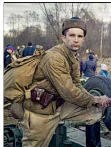
Мужают юноши в бою

Для будущих механиков и автолюбителей найдется отдельное направление: исторической военной техники . Это огромная работа, далеко не всегда заметная. Речь идет о ремонте, обслуживании и эксплуатации тех образцов автобронетехники, которые уже есть в коллекции клуба. Присоединяйся – и будешь с гордостью наблюдать на выставках и интерактивных мероприятиях плоды своих трудов.