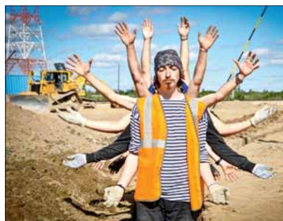
Так вот ты какой, СО многорукий!