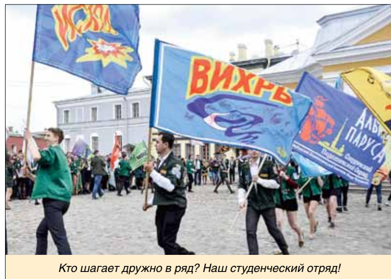
Кто шагает дружно в ряд? Наш студенческий отряд!

Трудовой сезон всегда пролетает быстро, оставляя яркие воспоминания, новые умения и верных друзей. Но и в учебном году студентов ожидает множество событий: спортивные и творческие конкурсы, индивидуальные состязания и межотрядные баталии, добровольческие и патриотические мероприятия.