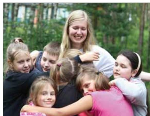
Неразрывное кольцо дружбы