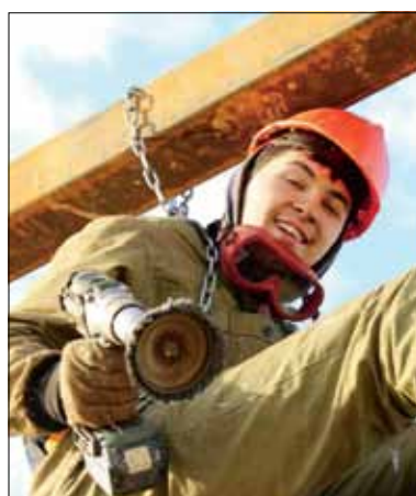
И кочегары мы, и плотники, и монтажники-высотники