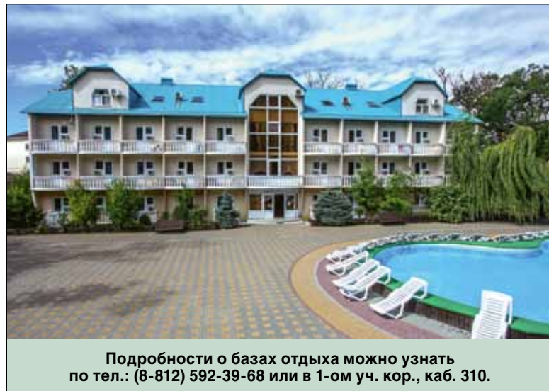
Подробности о базах отдыха можно узнать по тел.: (8-812) 592-39-68 или в 1-ом уч. кор., каб. 310.

крепость Изборск и Псково-Печерский монастырь. И еще одно преимущество: в этих краях можно познавая отдыхать и отдыхая узнавать, погружаться в атмосферу легендарных времен Александра Невского и в мир дворянских усадеб.