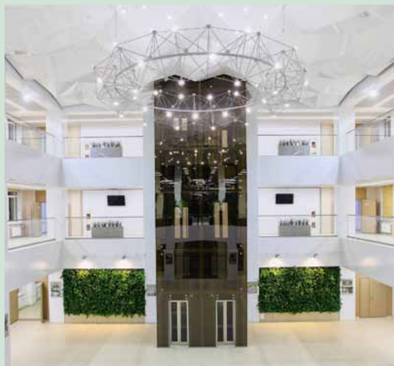
Фойе Научно-исследовательского корпуса, в котором расположен единственный на Северо-Западе суперкомпьютерный центр