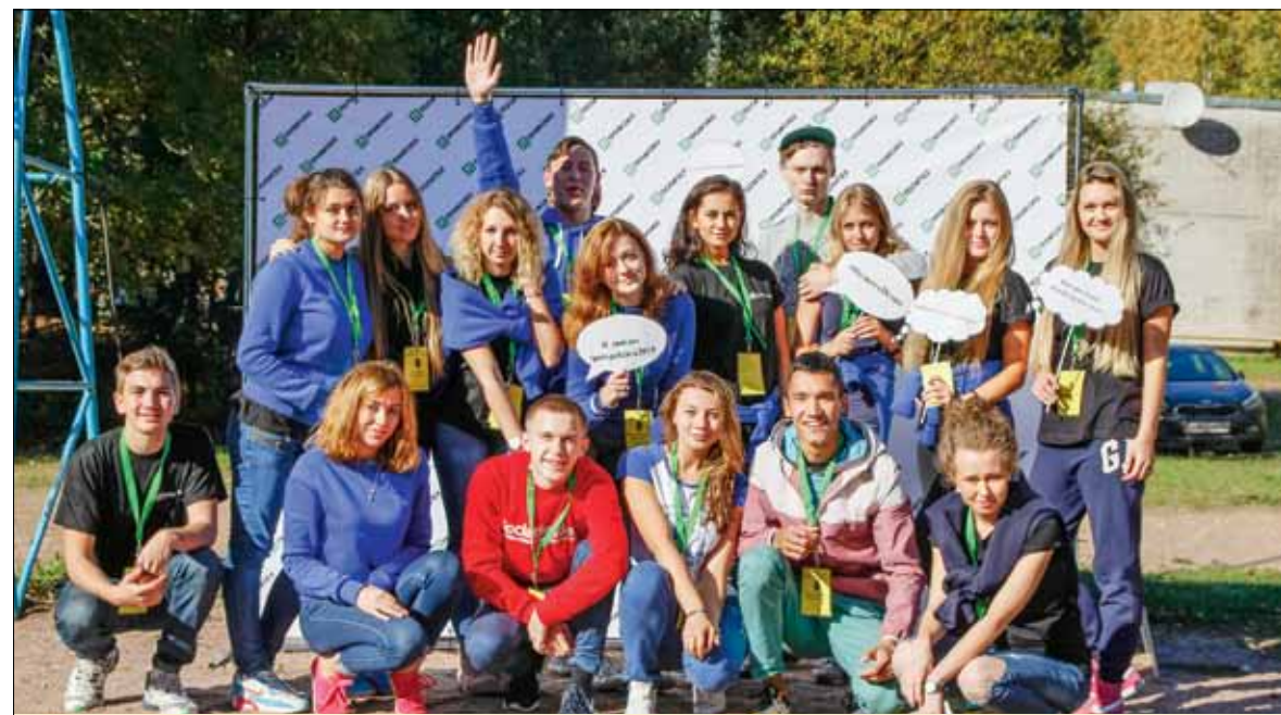
Внимание! Радость и веселье «отпускаются только членам профсоюза» (почти по О. Бендеру)