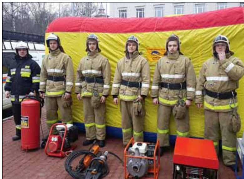
В этом строю огнеборцев есть место и для тебя, первокурсник!

Кто в детстве не мечтал вырасти и стать большим и сильным, как дядя пожарный, который ловко выпрыгивает из красной машины и смело бежит прямо в дым и пламя, чтобы спасти людей? Если со временем желание попробовать себя в качестве огнеборца не ослабло, то вам прямая дорога в учебно-пожарную добровольную команду «Политехник»!