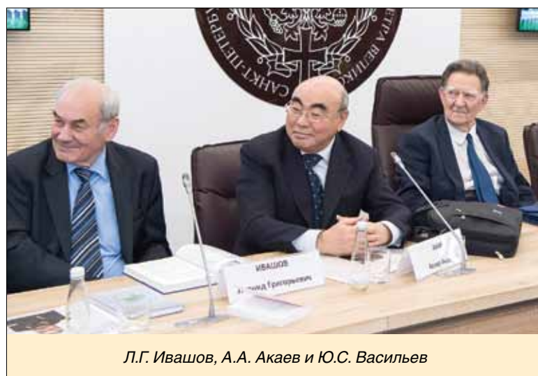
Л.Г. Ивашов, А.А. Акаев и Ю.С. Васильев

Президент Академии геополитических проблем, генерал-полковник Л.Г. Ивашов сообщил, что