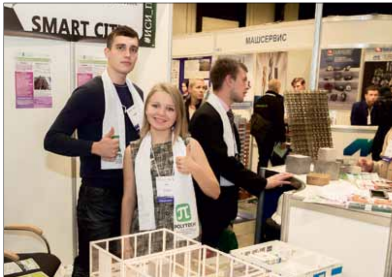
Представители ИСИ знакомят с проектом «Smart City», в основе которого – концепция современного умного и экологичного города