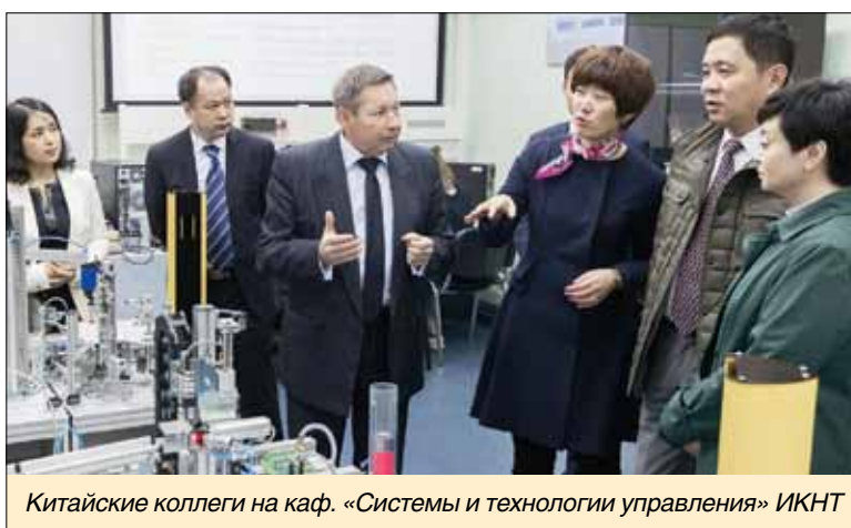
Китайские коллеги на каф. «Системы и технологии управления» ИКНТ

Ректор с удовлетворением отметил, что уже есть первые результаты деятельности центра – совместные публикации, обмен преподавателями. Немаловажно и то, что он оснащен всем необходимым оборудованием и учебно-методическими материалами. В настоящее время китайские студенты проходят тестирование по русскому языку для продолжения учебы в нашем университете.