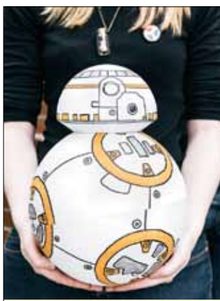
Студенческая «игрушка» – робот BB8 из фильма «Звездные войны»