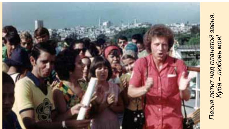
Песня летит над планетой звеня, Куба – любовь моя!

...И вот наконец остров Свободы. Фестиваль продолжался неделю, и все эти дни страна не работала. К нам на корабль приходил Рауль Кастро, а вот Фиделя не видели. В подарок кубинцам мы привезли несколько новеньких Икарусов с