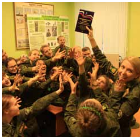
Военный устав – лучший друг студентов

После перерыва мы шустро вернулись на места. Нас проинструктировали, разделив на взводы и отделения. Затем поступил приказ проследовать на построение.