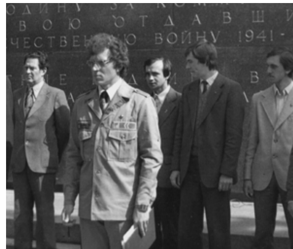
1982 г. Митинг перед отъездом ССО на студенческую стройку