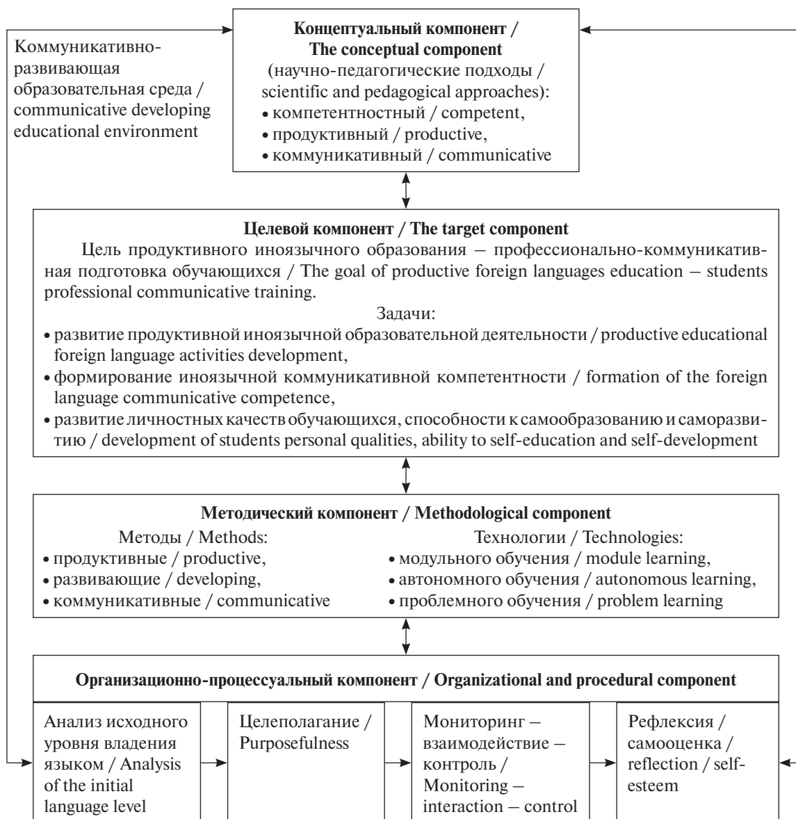
Методическая модель продуктивного иноязычного образования Methodical model of productive foreign language education

ного подходов в их взаимосвязи и взаимообусловленности.