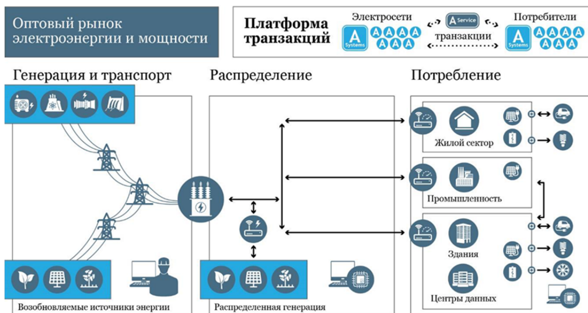
Рис. 2. Целевое видение российской электроэнергетики