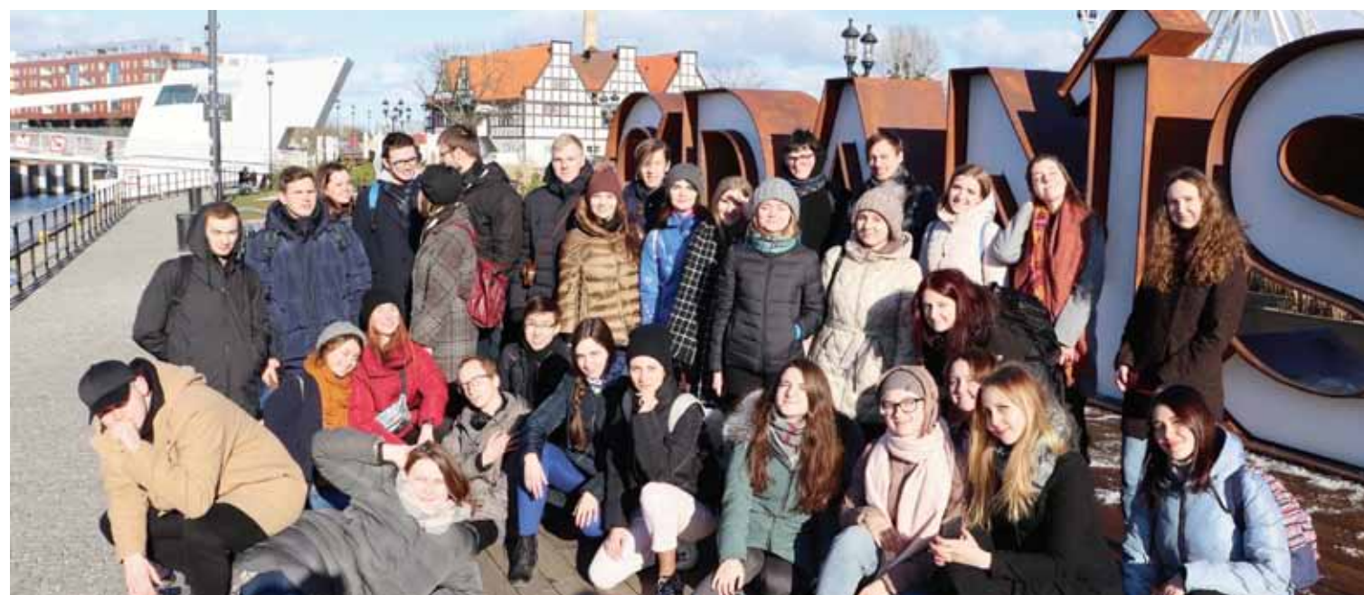
Молодёжный хор «Полигимния» в г. Гданьске (до пандемии)