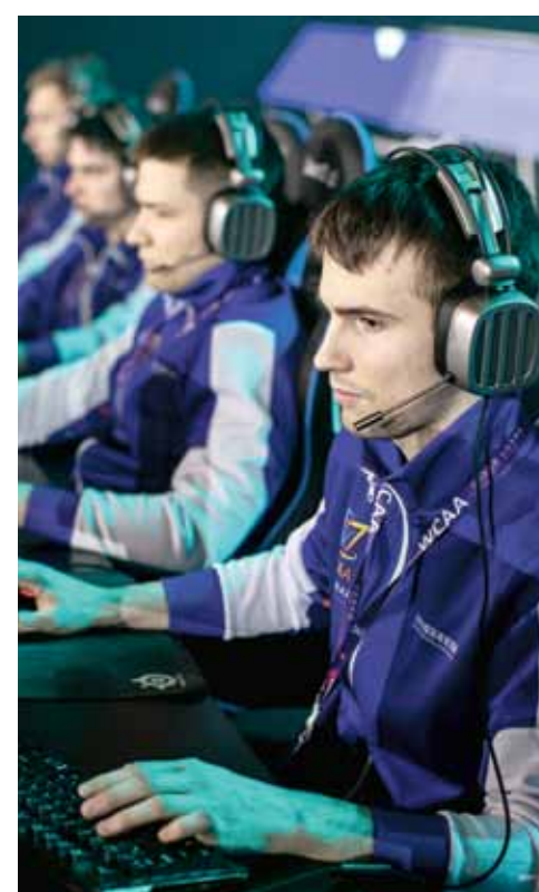
Турнир по киберспорту

Спортивный Клуб «Политехник» надеется, что уже скоро тренировки и матчи вернутся в прежний формат. Но какой бы ни была ситуация в городе, мы готовы ворваться в новый учебный год с интересными и захватывающими идеями для наших рубрик в социальных сетях!