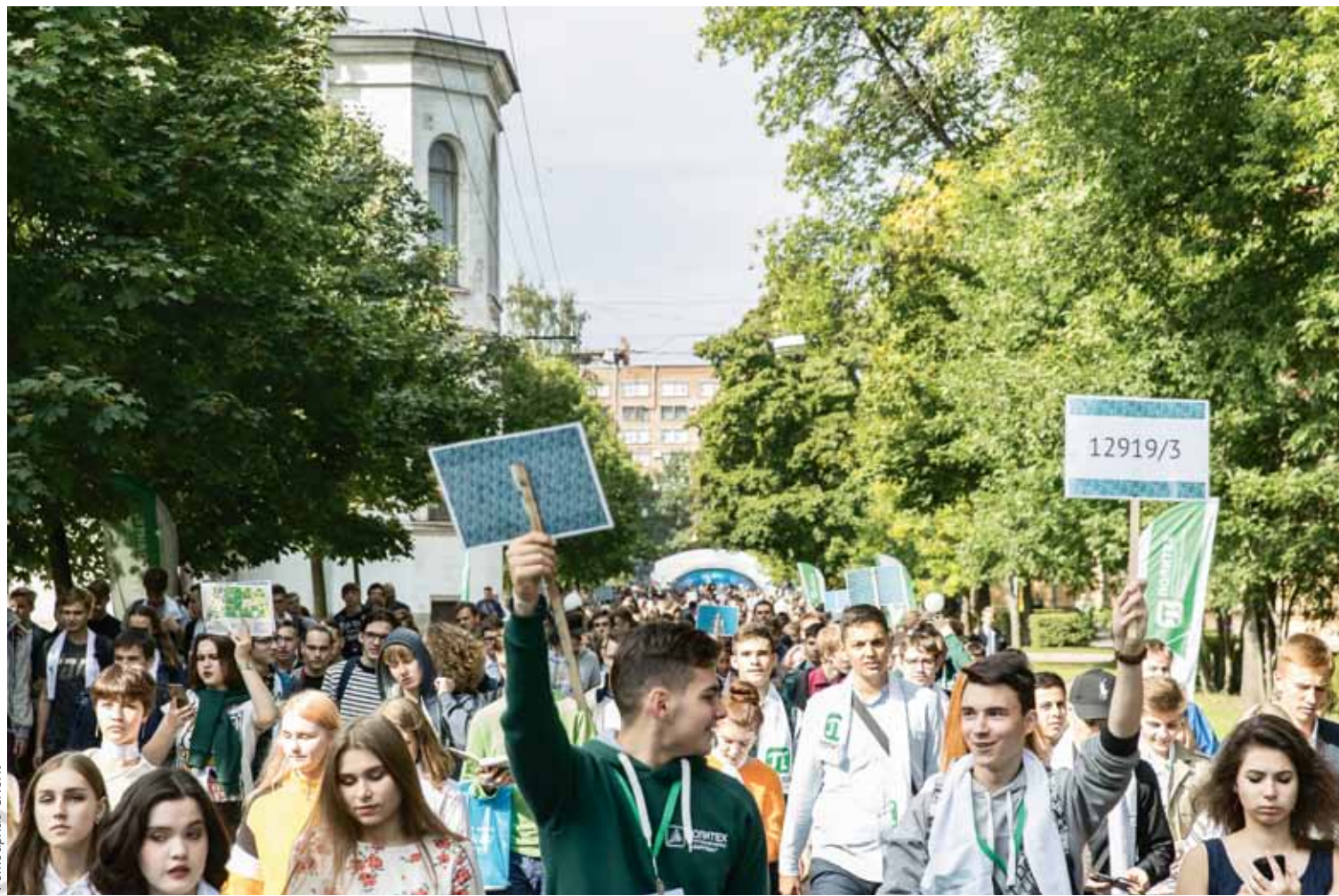
В День знаний, после торжественной линейки, первокурсники отправляются в «Облачный квест» по кампусу, чтобы познакомиться с историей и возможностями Политеха

Помимо канцелярских принадлежностей и сувениров для родных, там найдутся долговечные обложки для студенческого и зачётки, а также тёплые непродуваемые толстовки, которые обязательно согреют промозглым питерским вечером.