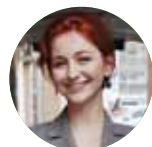
Автор Людмила ФЕДОТОВА

В этом году студенческие объединения опробовали цифровую форму деятельности. О том, как успешно существовать в условиях удалённой работы, не терять командный дух и смело строить планы на грядущий семестр – в нашем материале.