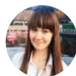
Автор Полина ЦЫБУЛЬНИК

Спортивный онлайн-сезон показал, что работать, проводить соревнования и быть активным можно не выходя из комнаты.