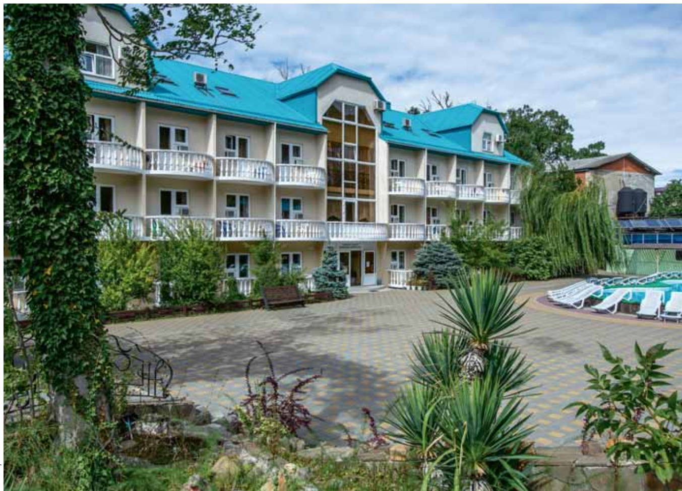
Учебно-оздоровительная база «Политехник» в Туапсинском районе Краснодарского края – или лагерь «Южный», как его чаще называют студенты и сотрудники вуза, в 2019 году отметил 60-летие

Глюкоза полезна для работы мозга, а вкусными пышками иногда можно побаловать себя и своих друзей. Если, конечно, не боитесь длинных очередей.