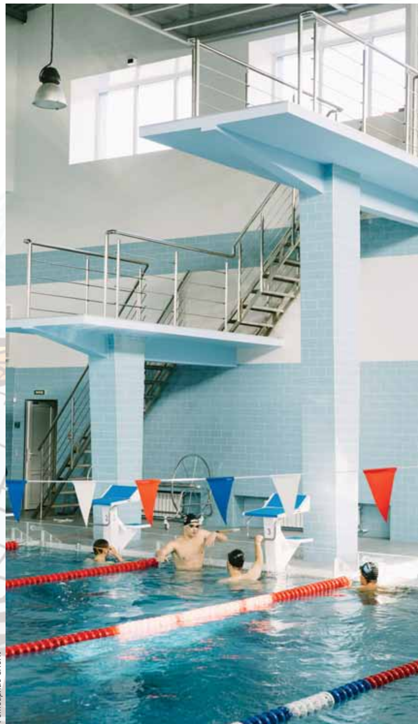
Спорткомплекс с бассейном открылся после реконструкции три года назад. Для студентов и сотрудников Политеха абонементы со скидкой