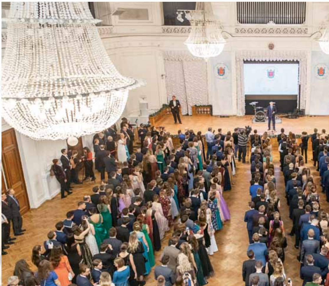
В Белом зале Политеха с 2014 года проходит Губернаторский бал для лучших студентов вузов и колледжей Санкт-Петербурга

Не важно, где жить – в отдельной квартире или в общежитии – полуфабрикаты всегда проигрывают домашней еде. Даже если навык готовки минимален, не ленитесь готовить. Кроме того, в Политехе есть несколько столовых и кафе, где кормят разнообразно и вкусно. Цены – вполне подъемные для студенческого кошелька.