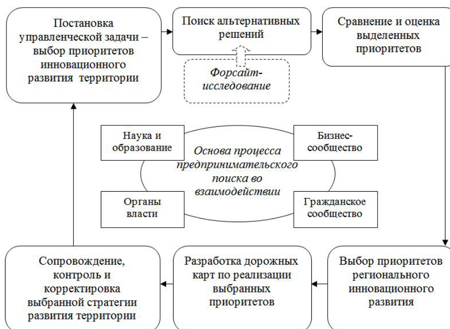
Рис. 3. Процесс предпринимательского поиска регионального инновационного развития