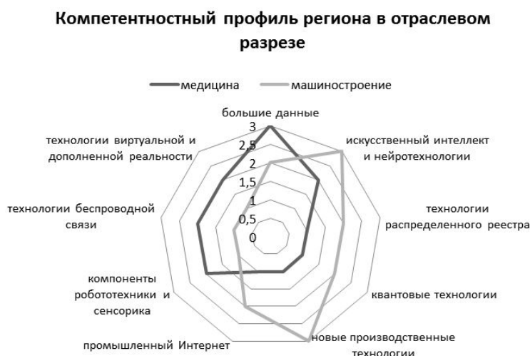
Рис. 2. Пример определения уровней сформированности компетенций региона в общей картине сквозных цифровых технологий